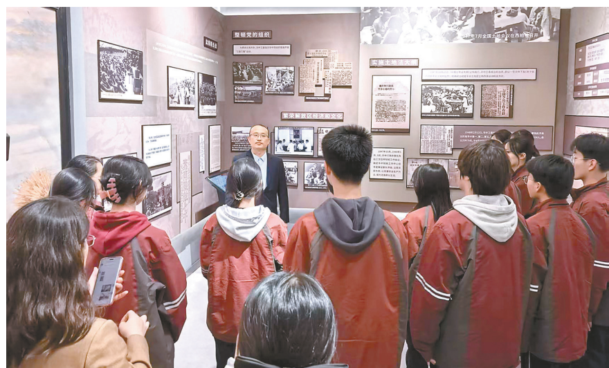
盐城市京师实验学校在五条岭烈士陵园开展实践教学

本报讯(记者 邓兆冲)为进一步加强革命传统教育和爱国主义教育,深化教育教学改革,创新思政课教学方式,切实推进盐城市“博物馆里的思政课”建设,根据《2025年盐城市深入推进“大思政课”建设实施方案》要求,10月30日至31日,由盐城市教育科学研究院主办的省基础教育前瞻性教学改革试验区《培根铸魂:新四军革命精神教育区域一体化的实践探索》盐城经开区区域联盟观摩活动举行,全市各县(市、区)近100名中小学思政骨干教师参加观摩学习。