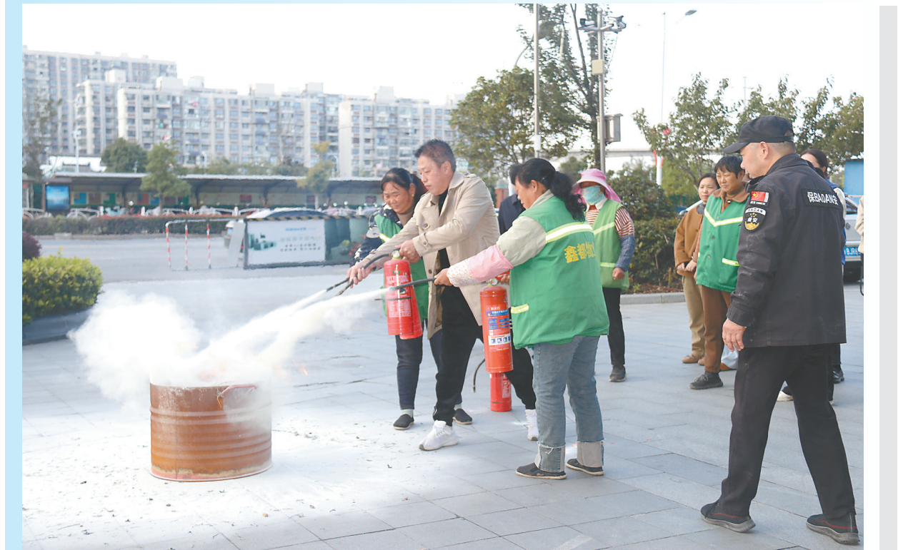
10月24日,亭湖区新洋街道新时代文明实践所联合新丰社区新时代文明实践站、网格服务管理中心,开展“消防零距离,安全共守护”主题消防演练活动,辖区内数十家商户代表及物业工作人员积极参与,增强消防安全意识,提升火灾应急处置和自救互救能力。

从生活照料到健康守护,工作人员用“暖心”服务、“贴心”关爱,把一件件实事办进老人心坎里。不仅让老人们深切感受到党和政府的关怀,更在全镇营造出“尊老为德、爱老为美、助老为乐”的浓厚社会氛围。