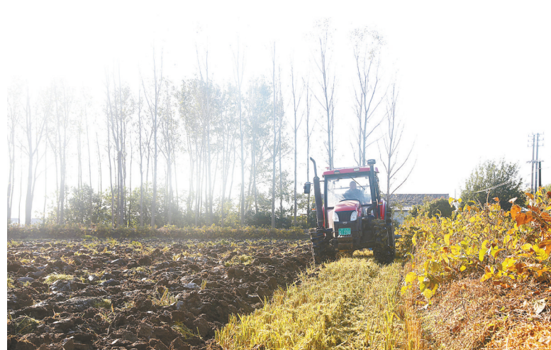
10月29日,大丰区白驹镇马家村6组,农民驾驶大马力拖拉机犁田,准备播种小麦。由于今秋降雨较多,水稻收割推迟,影响下茬种植。该镇农户因地制宜科学安排,适时抢收抢种,做到水稻收获一块,小麦播种一块,力争不误农时,为来年夏熟丰收打好基础。

“以前付款只会用现金,现在学会了用手机扫码支付,买东西方便多啦!”刚结束手机培训的村民王爷爷举着手机反复确认支付界面,脸上带着笑容。