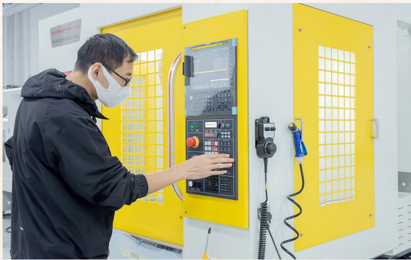
在滨海产业创新研究院,技术人员正在操作机器。

“离岸孵化+产能释放”的模式则让人才“引得进、留得住”。在苏州离岸孵化中心完成早期研发后,博萃循环装备项目正落户滨海绿岛智能制造