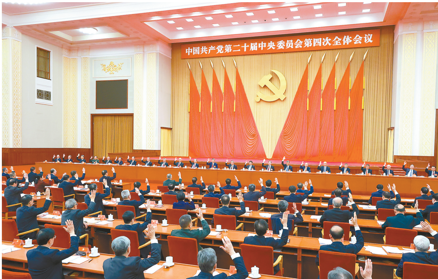
中国共产党第二十届中央委员会第四次全体会议，于2025年10月20日至23日在北京举行。中央政治局主持会议。