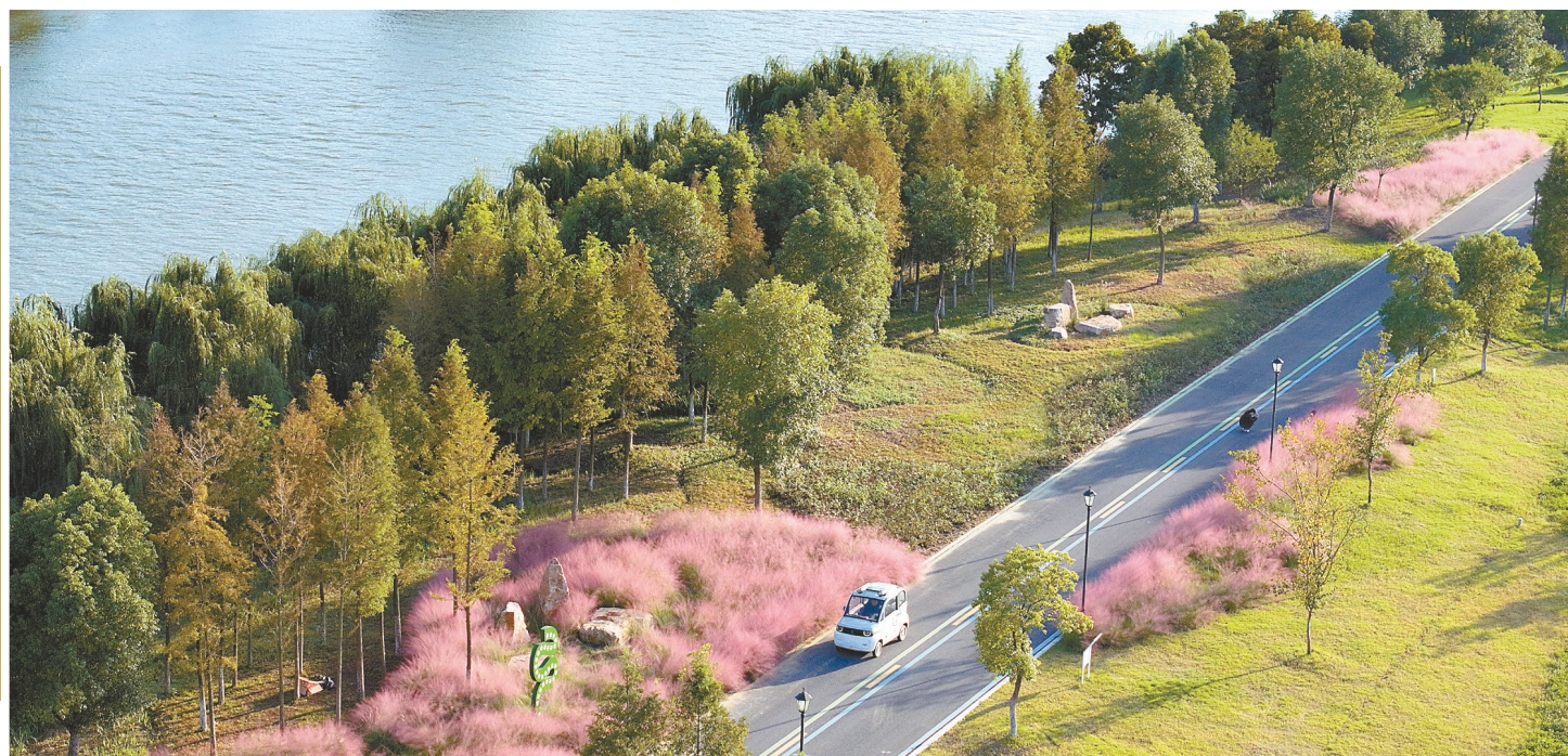
10月22日天气晴朗，市区蟒蛇河畔秋意正浓，两岸逐渐变黄的树叶、如云絮般铺在阳光下的湖面，在阳光下宛若一幅五彩斑斓的油画。蟒蛇河起始端为大纵湖，贯穿里下河腹部洼地，河道长近40公里，沿途田园风光、传统村落相互交融，成为游客休闲的好去处。