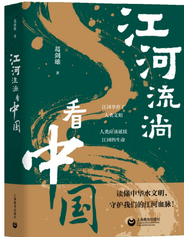
《江河流淌看中国》 葛剑雄 著 上海教育出版社