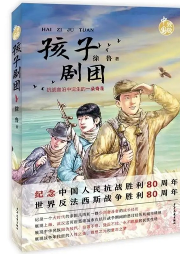
《孩子剧团》 徐鲁 著 少年儿童出版社