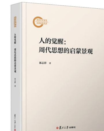
《人的觉醒：周代思想的启蒙景观》 祁志祥 著 每旦大学出版社