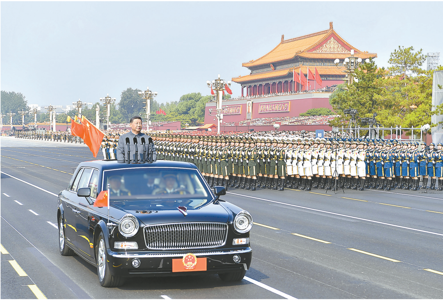
9月3日，纪念中国人民抗日战争暨世界反法西斯战争胜利80周年大会在北京天安门广场隆重举行。这是中共中央总书记、国家主席、中央军委主席习近平检阅受阅部队。