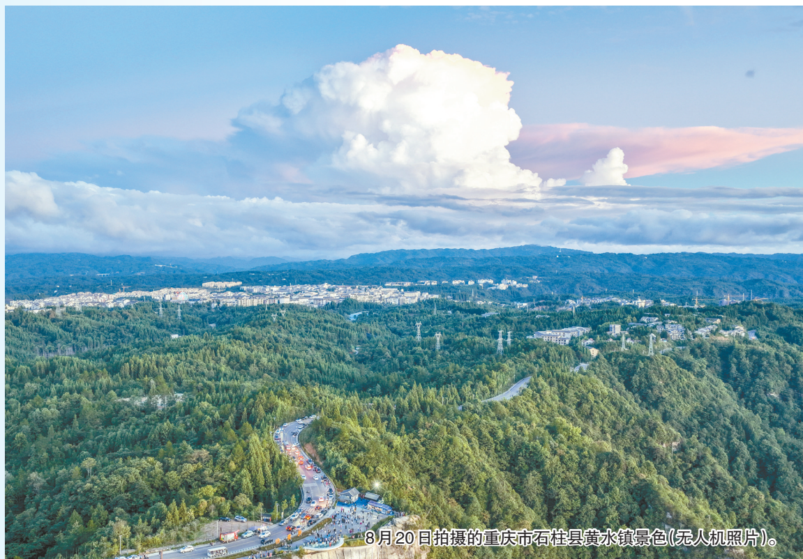
8月20日拍摄的重庆市石柱县黄水镇景色(无人机照片)。