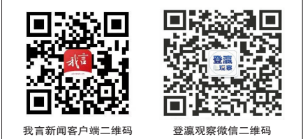
我言新闻客户端二维码