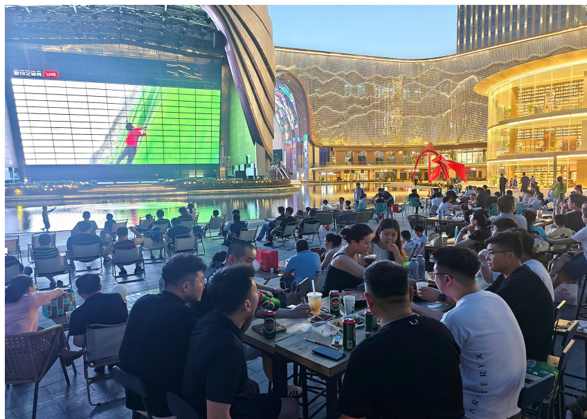
D·A艺术街区下沉广场,人们一边观看球赛一边享用美食