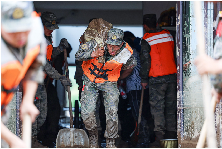
8月9日,武警甘肃总队机动支队官兵在兰州市榆中县城关镇兴隆山村帮助受灾群众转移物资。

据了解,国家综合性消防救援队伍已累计调派717人、124车、16舟艇、7犬参与救援;中国安能集团170余人携