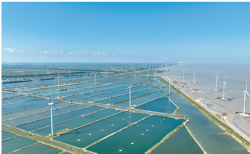
沿海风电场