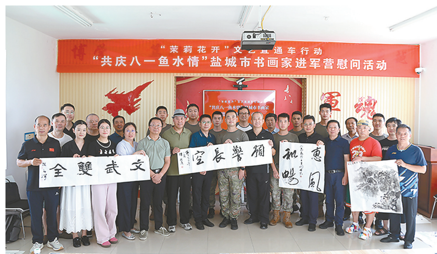
活动现场

本报讯(记者 朱大力)7月28日下午，为积极响应“茉莉花开”文艺直通车行动关于优质文化资源直达基层的部署，在庆祝中国人民解放军建军98周年之际，来自我市的书画家们走进驻盐部队，以笔墨为桥，开展“共庆八一鱼水情”书画家进军营慰问活动，向官兵们致以节日的诚挚祝福与崇高敬意，续写军民鱼水情深的时代篇章。