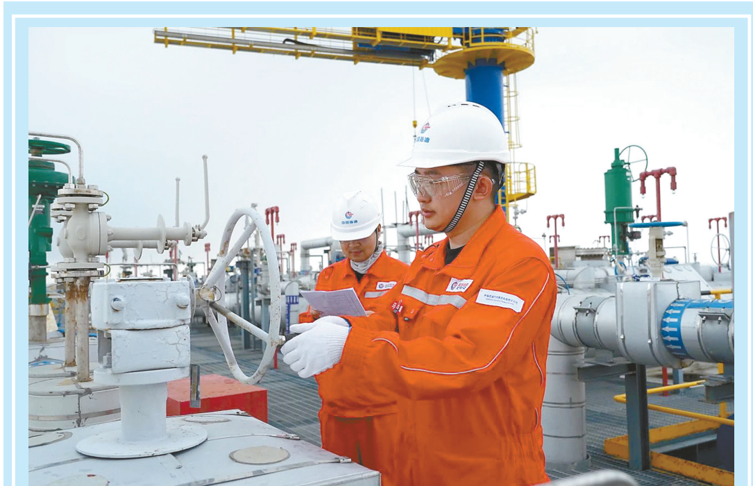
为推动江苏LNG高技能人才培养和人才梯队建设,7月15日至16日,江苏LNG举行2025年液化天然气操作工技能比武活动,进一步检验员工整体技能水平和应急处置能力。来自运行部工艺班组的31名参赛选手同台竞技,通过理论考试、案例分析、技能实操、安全技能四层挑战,顺利完成全部赛事。

滨海生态环境局将把此次活动作为推进生态文明建设的重要载体,作为贯彻落实国家、省市环保设施向公众开放指导意见的有力举措,并充分做好宣传,营造浓厚氛围,引导全民参与生态环境保护。