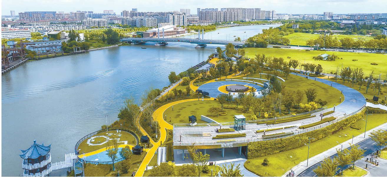
城市阳台