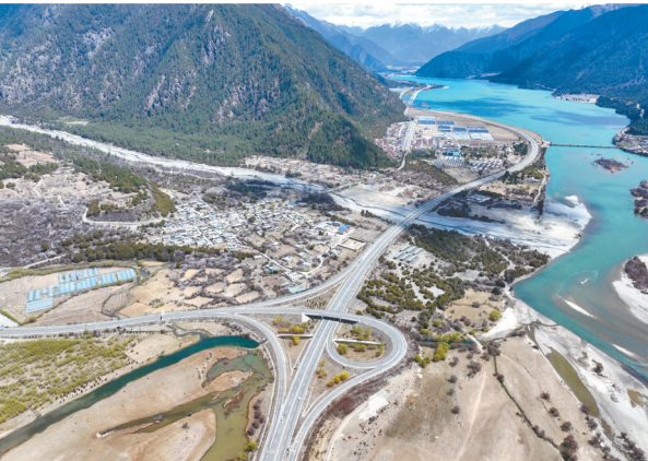
↳拉萨至林芝的高等级公路(无人机照片,2025年4月1日摄)。

党的十八大以来,西藏公路建设突飞猛进。2012年至2024年,西藏累计完成公路交通固定资产投资4019.25亿元,公路总里程从2012年的6.52万公里增加到2024年底的12.49万公里。 现在的西藏,交通基础设施建设日新月异,以拉萨为中心,辐射日喀则、山南、林芝、那曲的综合立体交通网络全面建成,助力经济社会发展,惠及各族群众。 汽车行驶在西藏S5线拉萨至泽当的高等级公路上(无人机照片,2025年7月31日摄)。