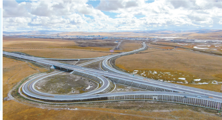
↳西藏那曲至拉萨的高等级公路(无人机照片,2021年9月27日摄)。