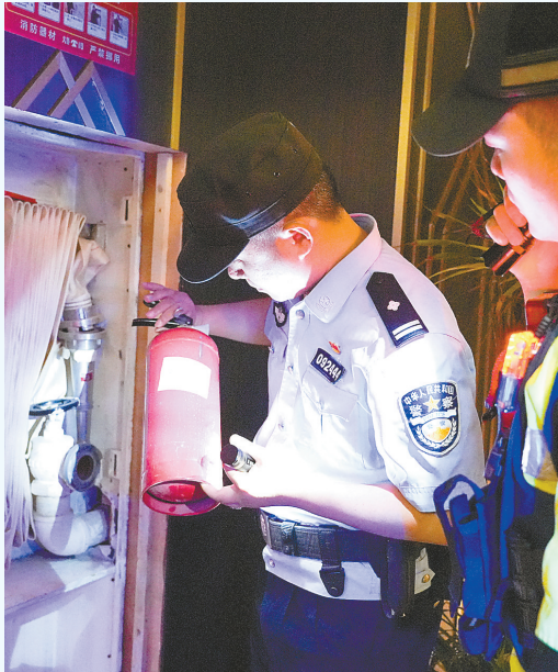
检查灭火器是否过期

繁星点点,微风轻拂。灯火下,是一抹抹奔走的“警察蓝”;人潮中,是一声声亲切的提醒与守护。他们用脚步丈量辖区、用汗水守护万家灯火,全力答好“夏季行动”这道平安答卷,让居民感受到平安就在身边!