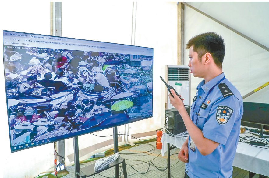
依托智慧警务系统,实时监测现场人流量