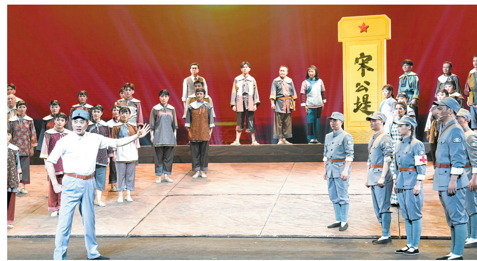
大型现代淮剧《宋公堤》生动再现当年军民鱼水情

1944年,毛泽东在修改审定10月1日《解放日报》社论时指出,新四军“已经成了华中人民的长城,成了华中人民血肉不可分割的一部分”。这是对新四军与百姓深厚情谊的高度赞誉,也是对新四军在抗战中发挥重要作用的充分肯定。