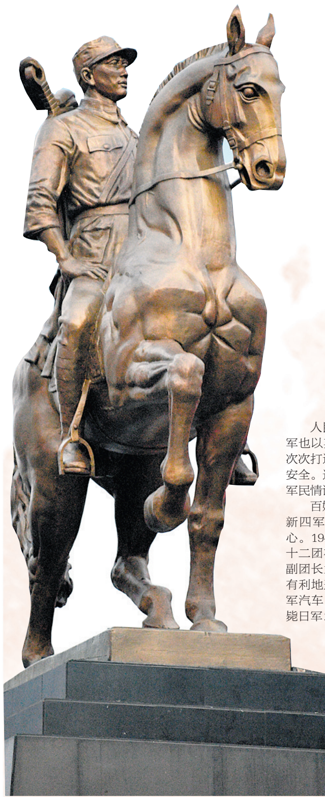
新四军重建军部纪念碑