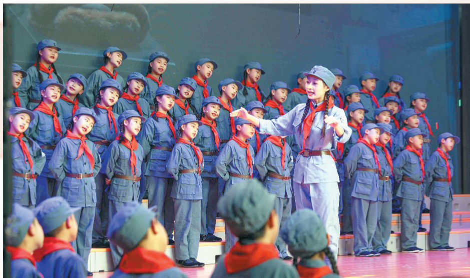
学生表演合唱《童声里的新四军》

盐阜大地永远铭记,那支为人民而战的军队,从未远去。他们用行动证明,共产党领导的人民军队始终与人民心连心、同呼吸、共命运,人民也始终坚定地选择共产党、拥护共产党,这种鱼水深情将永远熠熠生辉,激励着我们在新时代的征程上奋勇前行。