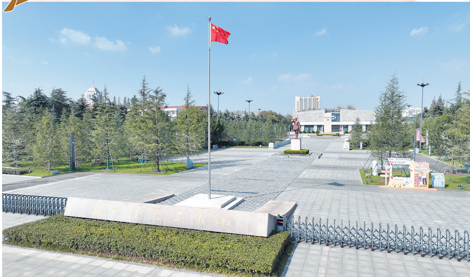
新四军纪念馆外景