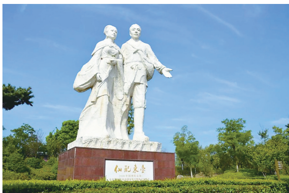
董永与七仙女雕像

临塔村的历史根系，深扎在泰东河的水波以及董永与七仙女传说的土壤里。村落坐落在曾是古老的运盐河道和入海水道的泰东河旁，因毗邻千年古塔“海春轩”唐塔得名，这个村域面积5.2平方公里的村落，不仅是神话传说“天仙配”的起源地，《二十四孝》人物董永的故里，也是远近闻名的“长寿村”。