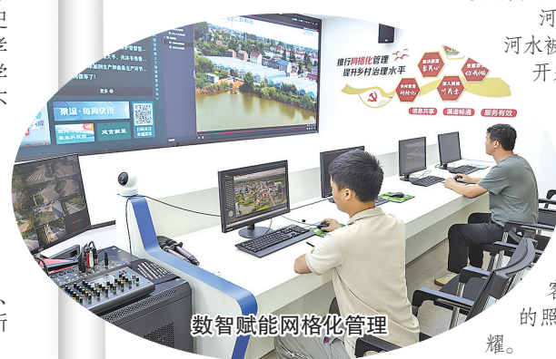
数智赋能网格化管理

村道上，几位身穿橙色工作服的保洁正在清扫着路面。扫帚过处，微尘翻滚，太阳的光斑透过稀疏的树梢，直溜溜地在地面上跑来跑去，每一个动作都是不紧不慢的，从历史弹至现实。