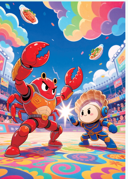
大纵湖螃蟹VS南通文蛤