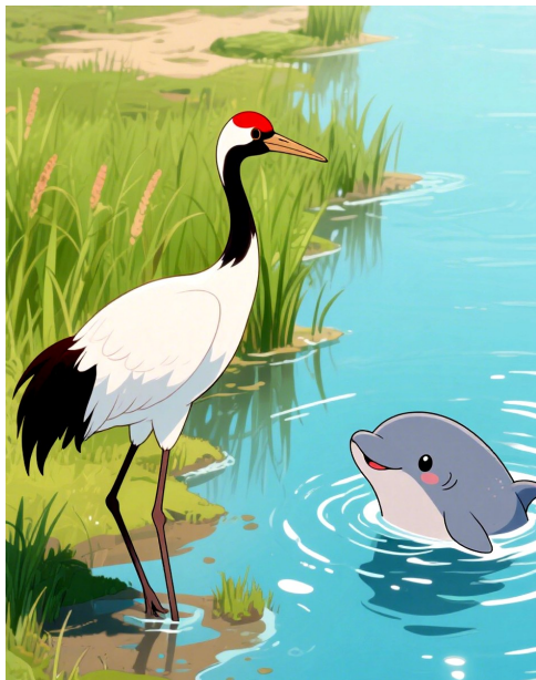
盐城丹顶鹤VS南通江豚

吃罢可以继续逛,登狼山极目,可看大江东去,如皋水绘园烟波渺渺,让人见而忘忧;西溪《天仙缘》表演情牵天上人间,荷兰花海“爱上夜花海”让球迷们在“夜晚的加时赛”里继续狂欢。球传情谊,携手未来。就让盐通高速铁路变成我们的友谊专线,让江风海韵继续唱响双城之歌吧。