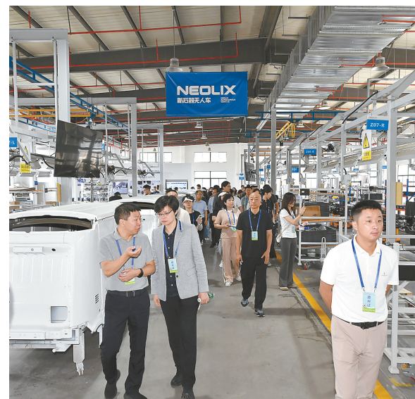
考察盐南高新区新石器无人车项目