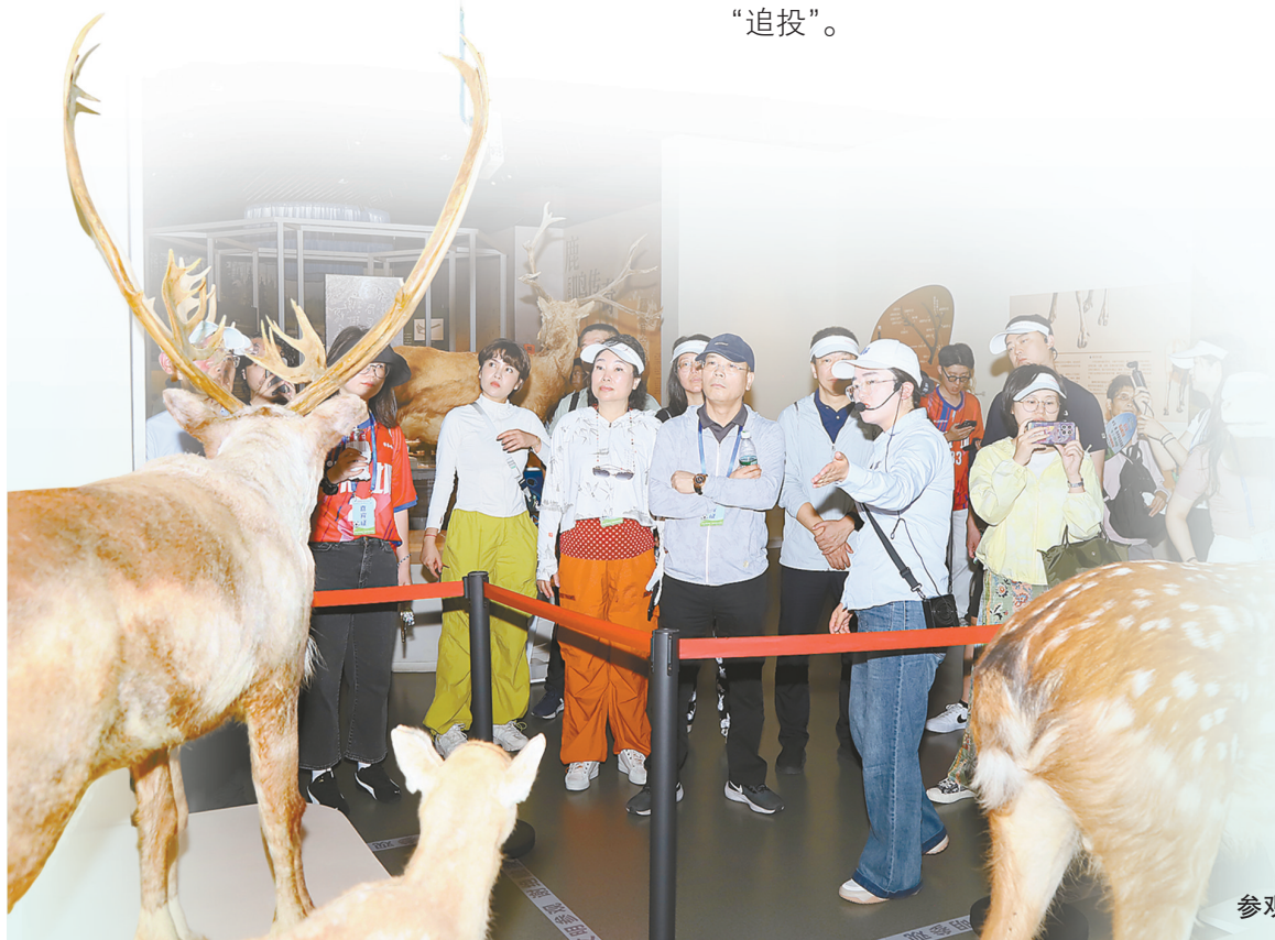
参观江苏大丰麋鹿国家级自然保护区