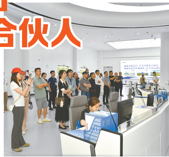
考察建湖县普渡机器人公司