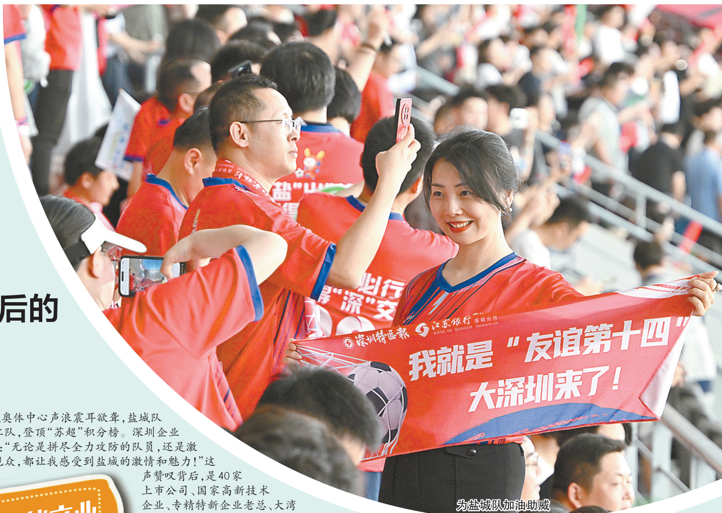
为盐城队加油助威