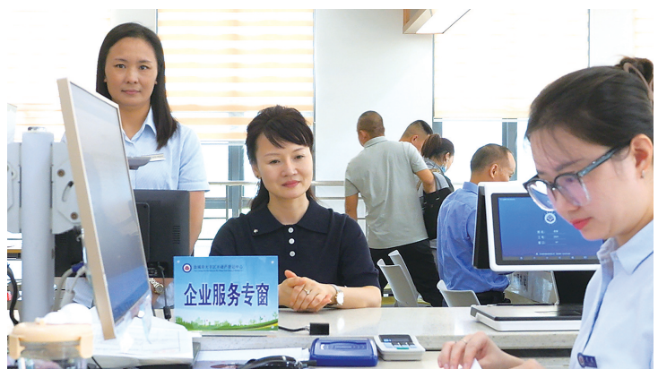
企业服务不动产登记窗口

登记服务提质效。 构建“1科室牵头+N个部门配合”的政务服务体系,加强部门协调联动和信息共享,上半年15家工业企业全部实现“交地即发证”和零材料首次登记。积极探索立体分层设权路径,颁发全市首本明确海域立体空间的不动产权证书。“交海即发证”做法被自然资源部评为优化营商环境登记营商环境典型案例。 创新举措解民忧。 常态化开展分幢(层)登记,上半年办理工业企业厂房按幢按层登记3件、抵押登记37件,满足企业多样化融资需求。探索司法拍卖场景下的“带押过户”模式,降低竞买人融资难度,缩短司法拍卖交易时间。完成16家烈士陵园变更登记,完善特殊项目办证工作。推动野生动物伤害政府救助责任保险落地,上半年受理理赔37单,理赔金额7.98万元,有效保障了受损农户的利益。 基础工作夯根基。 扎实开展国土变更调查,推进紧急用地即报即审、临时用地复垦地块日常变更调查等工作。有序推进大比例尺地形图更新项目,实景三维大丰建设项目,提升地理信息数字化水平。坚持依法行政,开展“百案百日”专项行动,全力化解行政信访和信访矛盾。