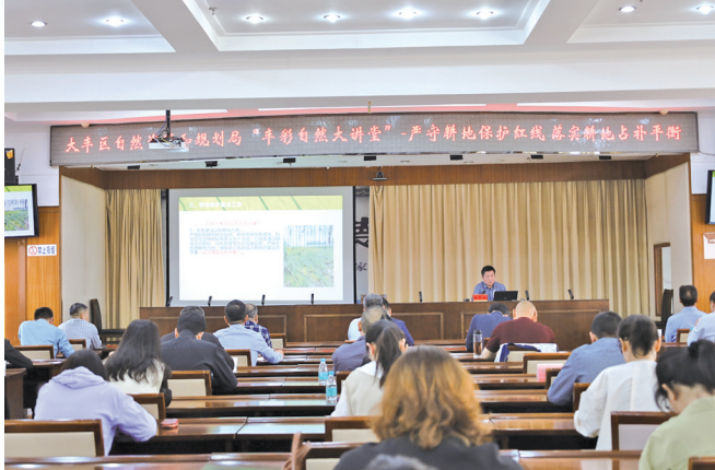
耕地保护专题培训