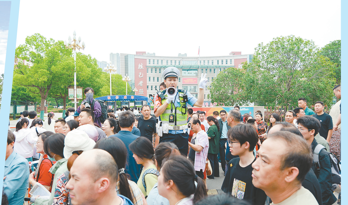
盐都分局民警在考点外围维持现场秩序。