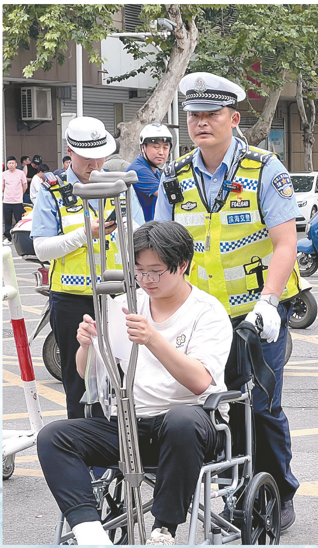
一考生因腿脚受伤拄拐行动不便,滨海县公安局执勤民警在考点的交通管制点提前做好轮椅,将考生推行至考场门口,同学们接力将考生搀扶进考场。

射阳县公安局考前组织警力对考点及考点周边开展安全大检查,切实消除安全隐患,全力为高考保驾护航。检查中,民警向考点相关负责人详细了解学校高考安保工作开展情况,重点对各考点的安保力量、视频监控、消防设施、应急通道及学校食堂卫生等情况进行了全面细致检查,对检查中发现的安全隐患,民警现场提出整改意见,要求负责人立即整改,确保高考各环节安全保障措施落实落细。考试期间,射阳县公安局组织执勤民、辅警提前到岗各考点,有序做好现场警戒带和隔离区域的布控工作,以警车开道,为送考大巴保驾护航。最大限度地吧警力摆到各考点周边以及考生住地周边,随时应对和处置各类突发事件,确保重点部位绝对安全。