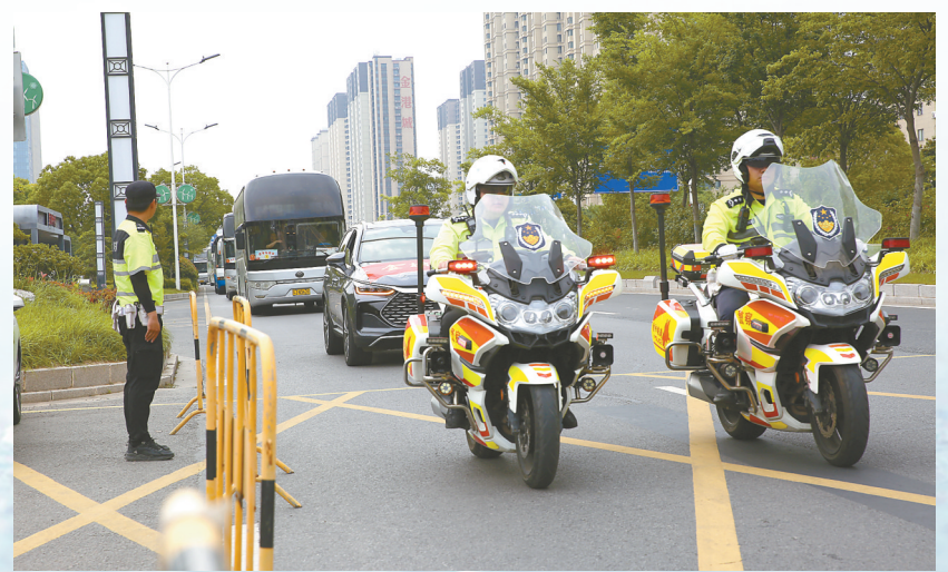
射阳交警引导送考大巴进入考点。