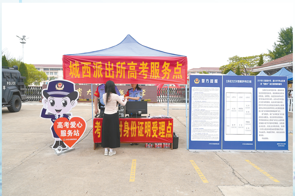
大丰公安局在考点设立高考服务点,现场可以为考生办理临时身份证。