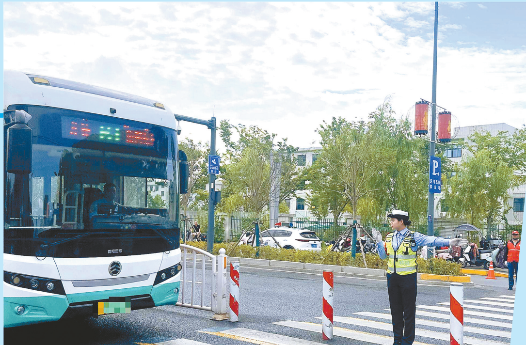
盐城交警在考点周围疏导车辆有序通行。