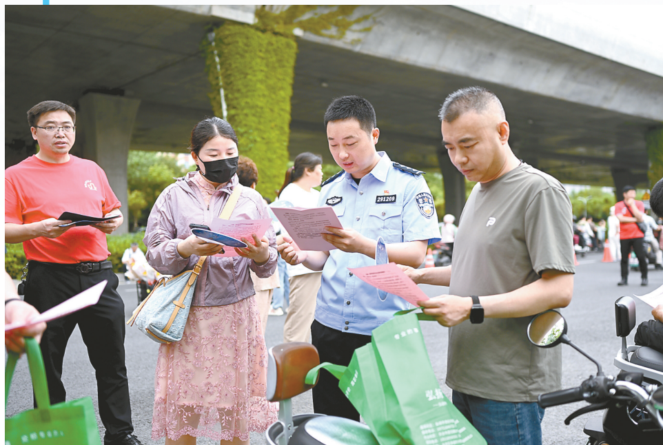
亭湖分局民警向等候考生的家长宣传反诈知识。