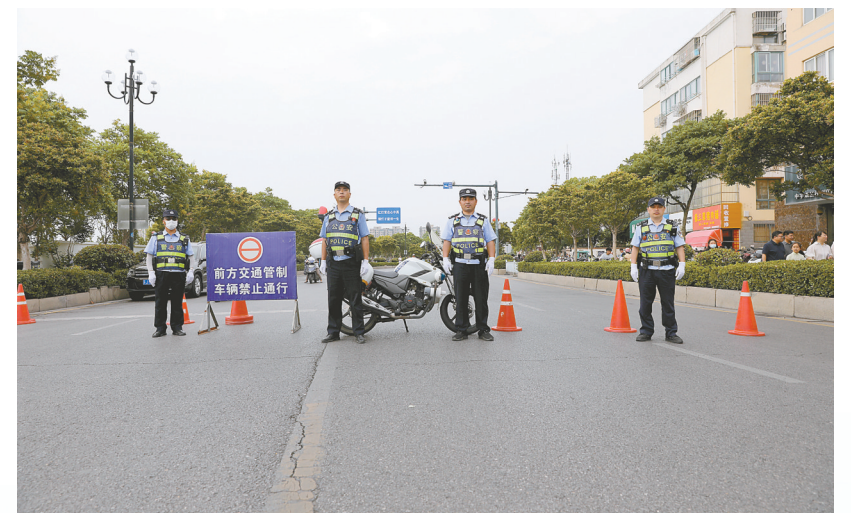
英语考试,建湖民警开启全城“静音”模式。