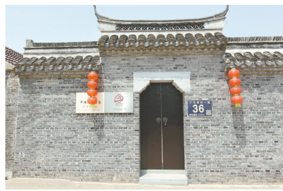
千年古村落华丽转身

2017年,江苏省在全国率先出台《江苏省传统村落保护办法》,盐城迅速响应,全力推进传统村落的保护利用工作。同年,盐都区楼王镇启动丁马港村传统村落保护规划编制,通过集中连片保护利用,整合乡村资源,按照“修旧如旧”的要求,对丁马港村古宅和古建筑进行修缮,突出“十字古街,一巷八弄”周边环境,形成“一水一村、多点多项”的保护结构。