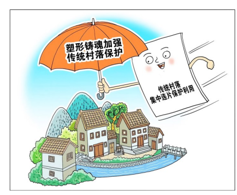
传统村落保护 朱会卿作