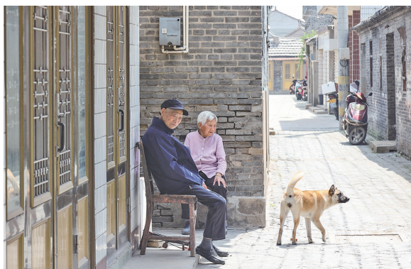
千年老街闲适时光

如今的丁马港村,辖区面积达9平方公里,由原丁马、丁西、水产三个自然村于2001年2月合并而成,下辖8个村民小组,2400余名村民。依托横塘河生态廊道,丁马港村正经历从农业主导到“三产”融合的转型。