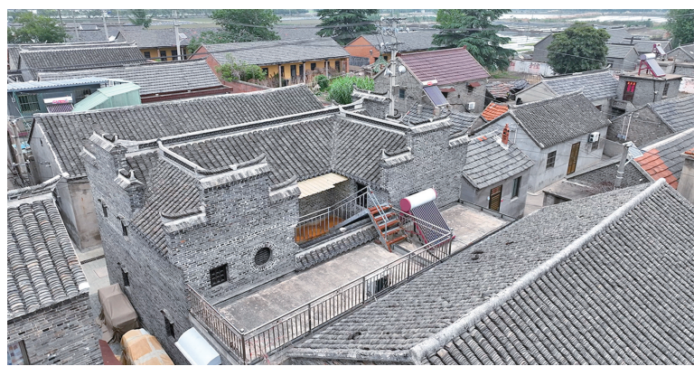
国家级传统古村落——丁马港村

五月的盐阜大地,草木葱茏,生机盎然。5月中旬,盐阜大众报业集团携手市住建局、盐都区住建局、市作家协会、市摄影家协会等一行十人,深入国家级传统古村落——丁马港村采风,在七十二间串街楼的斑驳砖雕间、吴氏古宅的雕花门楼下,聆听岁月沉淀的故事,见证传统村落保护与活化利用的生动实践。