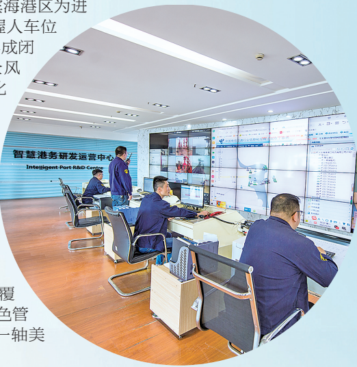
智慧港务研发运营中心

潮起海天阔,扬帆正当时。盐城港集团以“五新示范港”建设为引领,在绿色、生态、智慧、平安、美丽的道路上稳步前行,以“亿吨吞吐量”为新起点,在黄海之滨书写新时代的蓝色传奇。