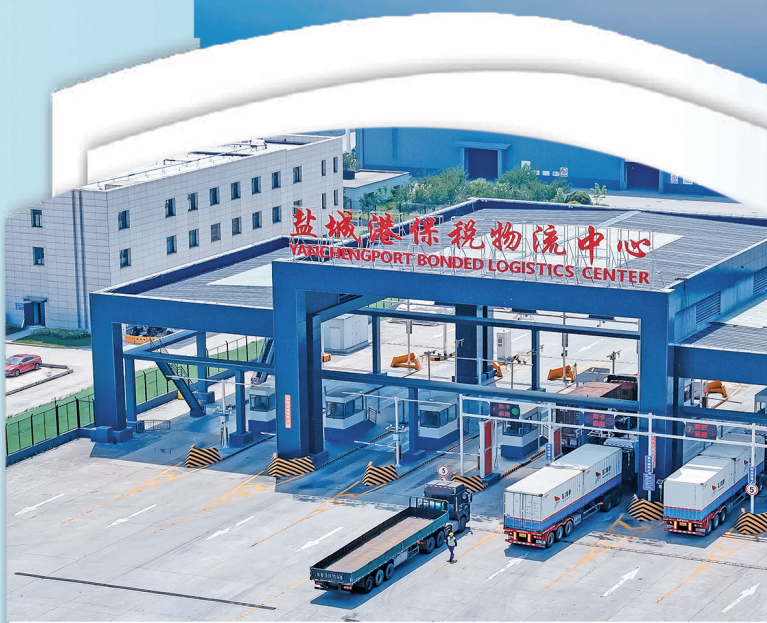
盐城港保税物流中心