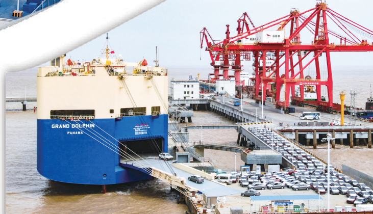
汽车通过盐城港出口海外