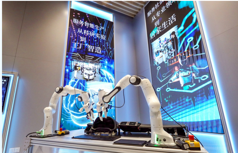
4月29日拍摄的位于上海市徐汇区的“模速空间”内展示的人工智能产品。