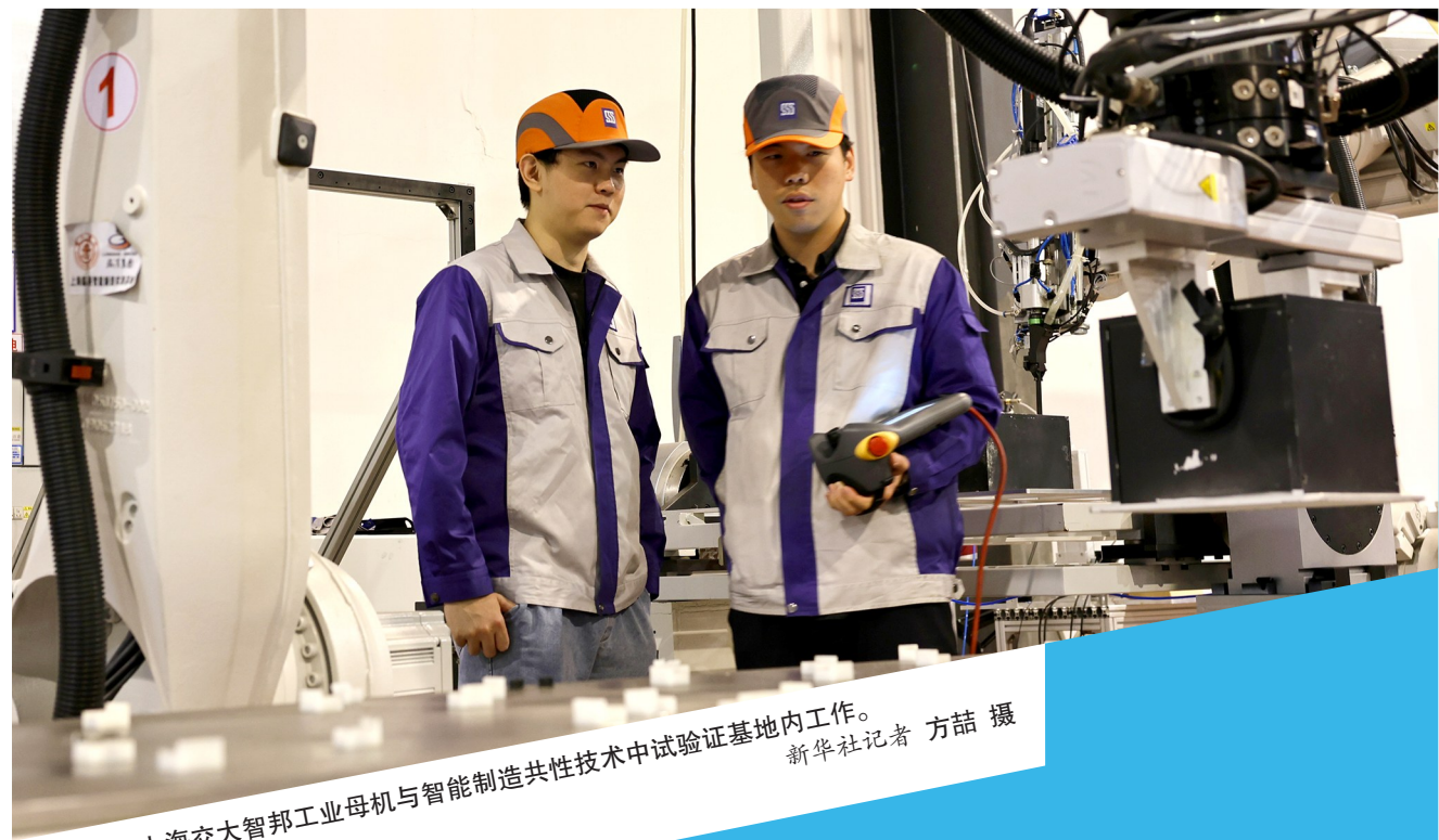
技术人员在上海交大智邦工业母机与智能制造共性技术中试验证基地内工作。