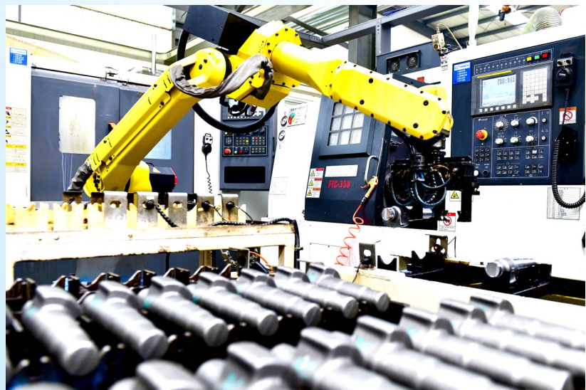
5月21日，金马工业集团股份有限公司工业机器人在加工汽车零部件。