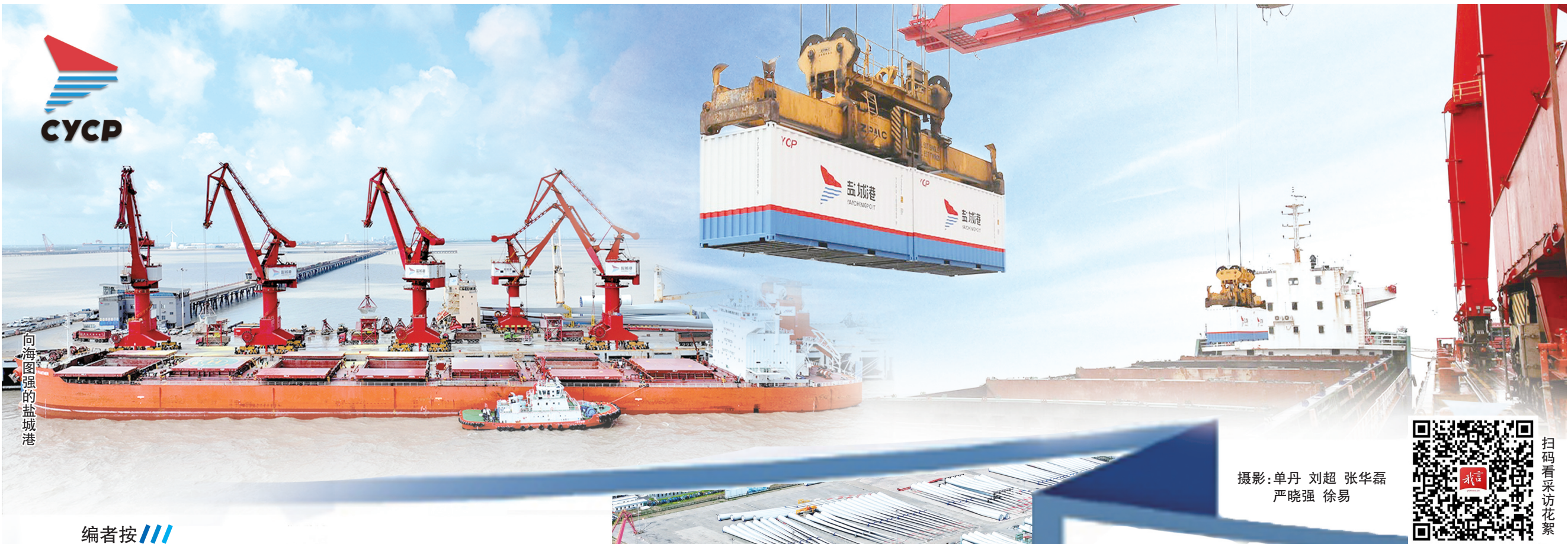
向海图强的盐城港