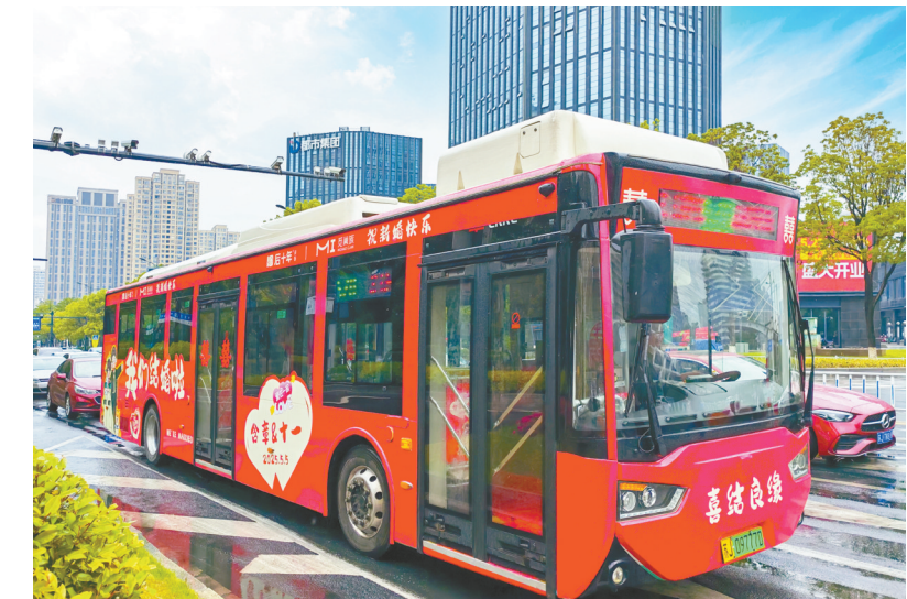
装饰一新的公交婚车

上演了一场别开生面的空中竞技。 开赛前，组委会举行了简短而隆重的开幕式。盐城市航空运动协会会长柏亚闻阐释了全国青少年无人机大赛的重要意义，他表示，青少年无人机大赛盐城市赛项目涵盖无人机理论、组装调试、场景应用等多方面技能，能有效提