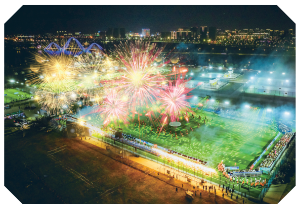
青年体育公园社超联赛开幕式