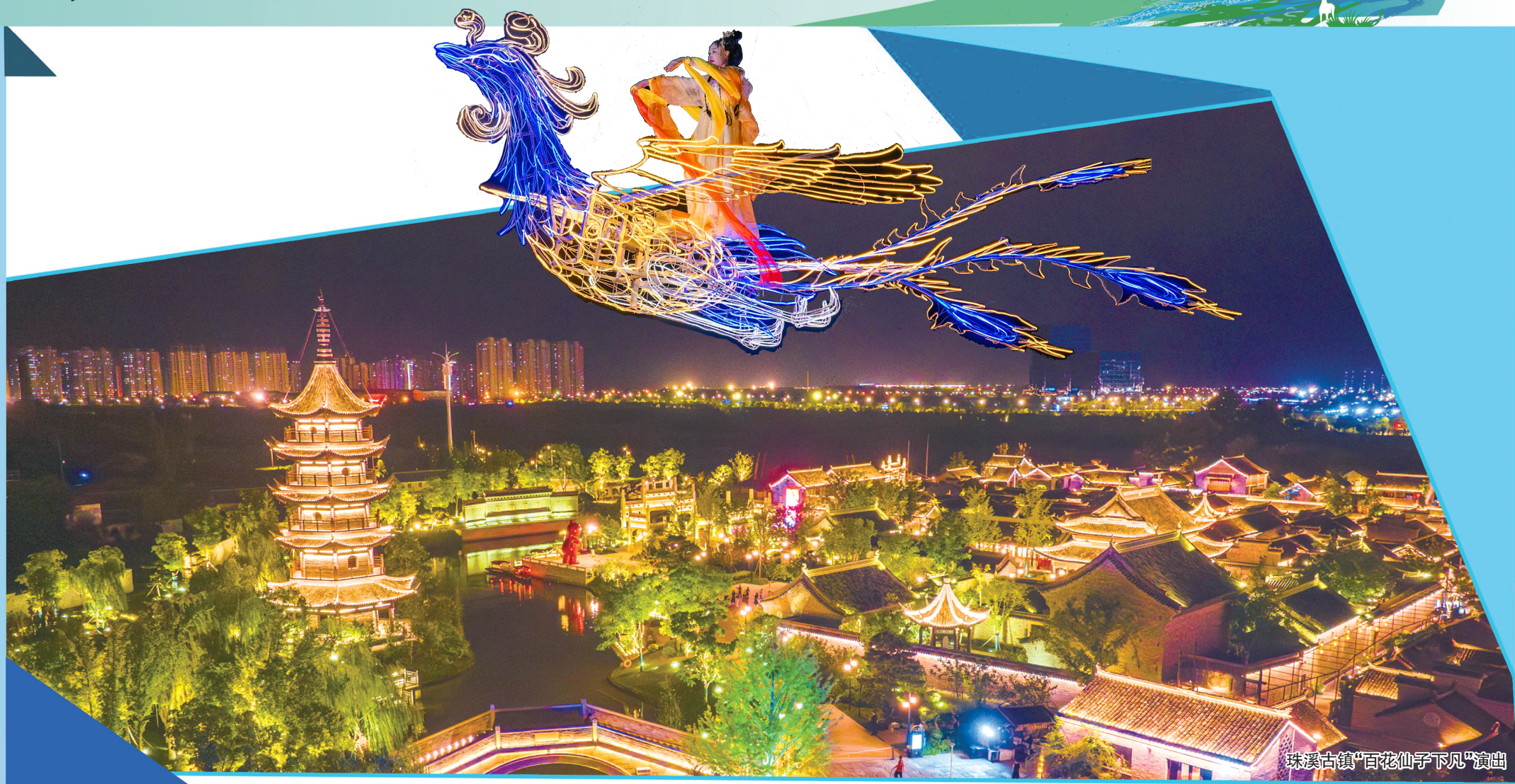
珠溪古镇“百花仙子下凡”演出