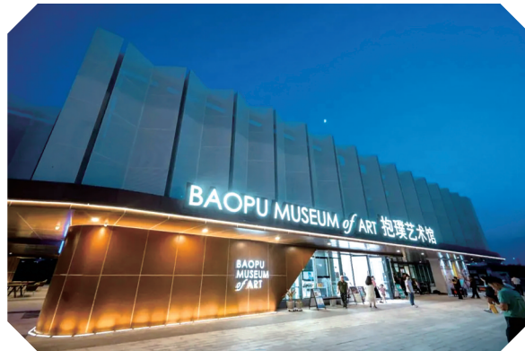
D·A艺术街区抱璞艺术馆