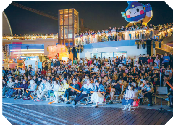
串场之眼“青春盐途遇见你”高校联谊会