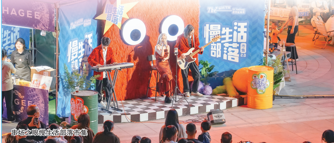
串场之眼慢生活部落市集

刚刚过去的“五一”假期,珠溪古镇依托文学经典《镜花缘》,将非遗技艺和国潮演艺完美融合,成功打造全域“沉浸式”文旅新体验,为游客带来一场穿越时空的文化奇幻之旅。