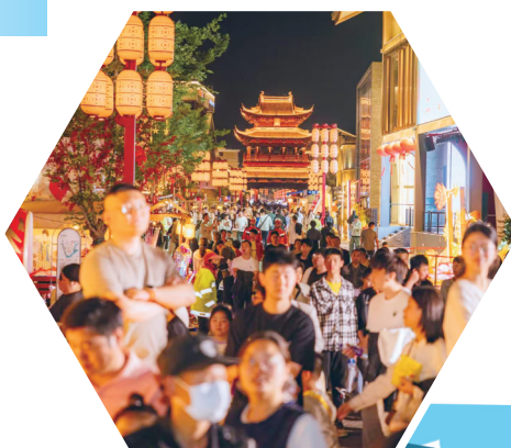
珠溪古镇东西大街