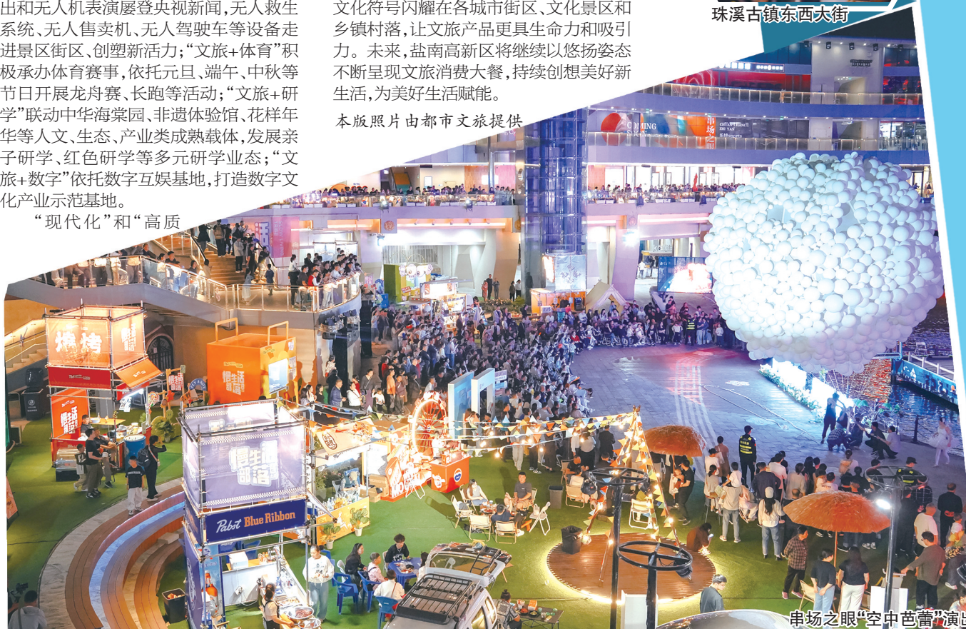
串场之眼“空中芭蕾”演出