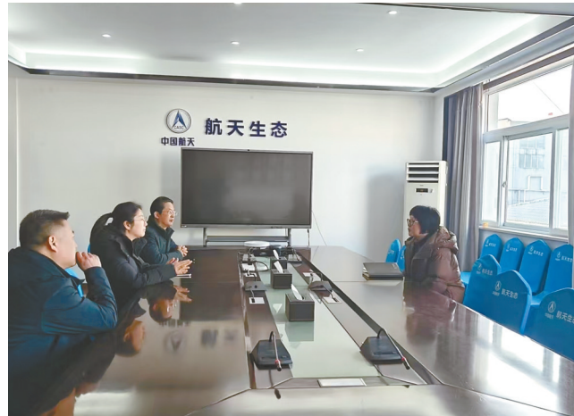
工行与企业洽谈融资业务