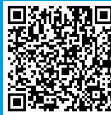
扫描二维码 观看数字人播报