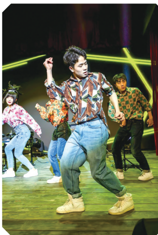
竹林大饭店精彩演出