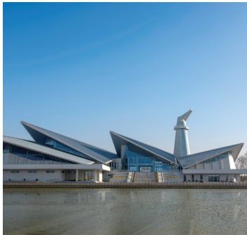
盐城丹顶鹤湿地生态旅游区

积极推动潮间带艺术村、便仓枯枝牡丹园、竹林大饭店申报创建国家3A级旅游景区。目前,潮间带艺术村和便仓枯枝牡丹园已顺利通过国家3A级旅游景区景观质量评审,正式进入为期一年的建设提升阶段。