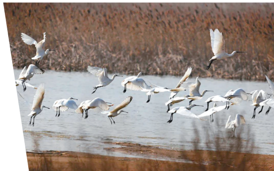
盐城丹顶鹤湿地生态旅游区