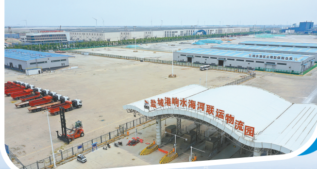
省级示范物流园——海河联运物流园