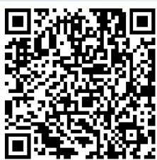
扫描二维码 观看数字人播报