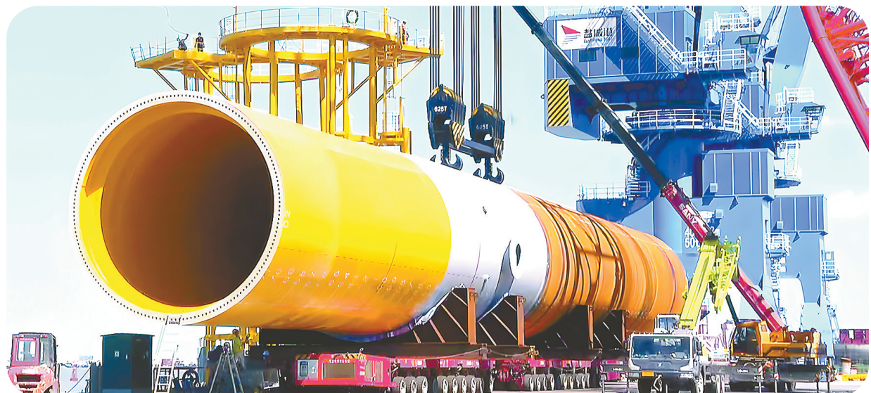
海工装备新标杆——江苏天能海洋重工

坐拥43公里海岸线,46公里灌河岸线,国家一类开放口岸……响水的海洋资源优势毋庸置疑。在深耕蓝色国土、壮大海洋经济上,响水全力聚焦海洋产业突破,持续提升海洋经济发展能级,不断将蓝色流量和绿色容量转化为发展增量,跑出了建设海洋强县的“加速度”。