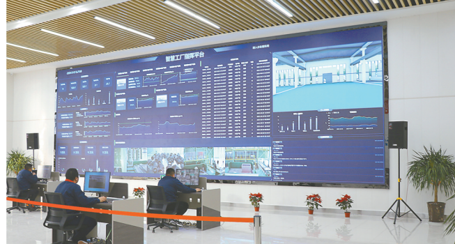
省级创新创业示范基地——不锈钢产业园(智慧中心)