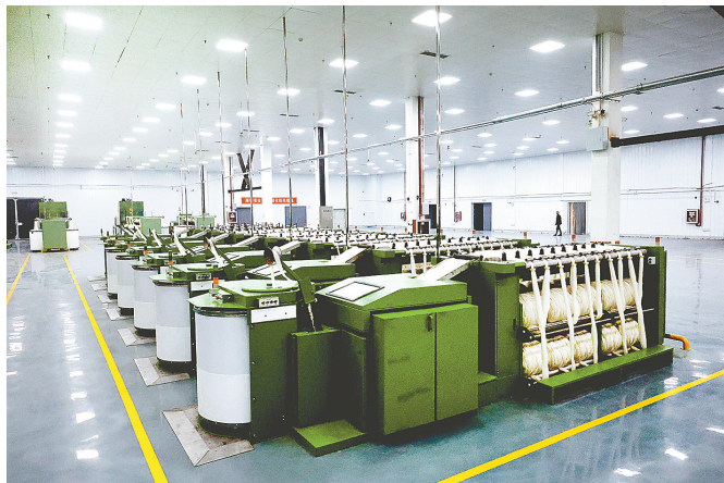
国内羊毛行业龙头企业——金盟纺织

照进现实。响水创新结合“绿色能源”和“蓝色粮仓”,不仅实现海洋资源集约高效开发利用,还为全县海洋产业发展注入新活力。响水多元化发展海洋新能源产业,加快推进新型储能、集中式光伏电站、储能电站等一批项目落地建设,打造新能源产业发展新高地。大力推进长江三峡风电“以大代小”机组换新、新华兴海200MW、灌东盐场150MW等渔光互补项目建设,前瞻谋划风电制氢、光伏制氢等氢能产业,加快“风—光—氢—储—用”一体化发展,持续推动绿色低碳经济发展。