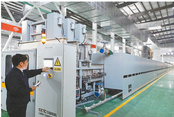
锂电池正极材料生产领军企业——乾运高科

向海图强,产业支撑是关键。响水不断优化海洋产业结构,推动传统产业转型升级,积极培育新兴产业,大力发展海上风电、海水养殖等,在“高新蓝”的赋能下,深挖海洋富矿。