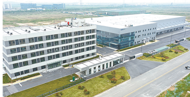
新能源产业“新秀”——吉利·极电储能集成设备