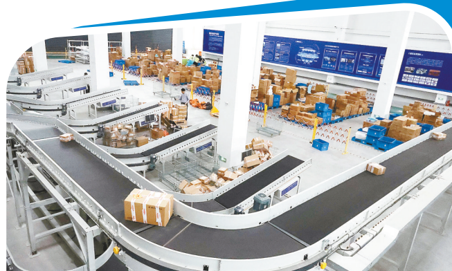
苏北地区规模最大、标准最高的智慧云仓之一——京东云仓