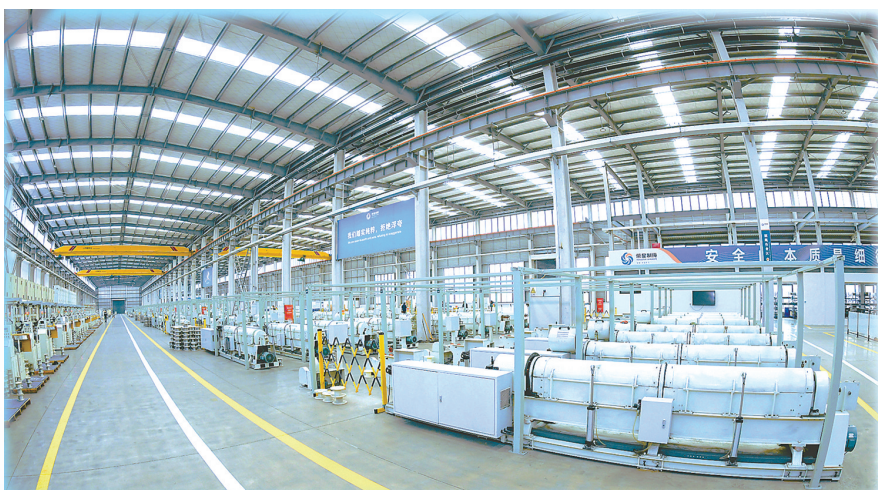
“医疗器械钢丝绳”国际产品生产企业——荣星制绳

“大风车”转出“新”风景。在广袤的响水大地,陆上、海上300多台高大风机迎风矗立,亮翅海鹰,机翼缓缓转动,一场风与电之间的能量交换悄然进行,每年可向江苏电网输送清洁能源18亿度。风力发电只是绿色能源阵营的一员,三圩盐场海边集中式光伏电站项目是该县在海洋资源利用的一次大胆尝试,占地966亩的12万块光伏板,把渔光互补、农光互补的海洋经济开发新模式