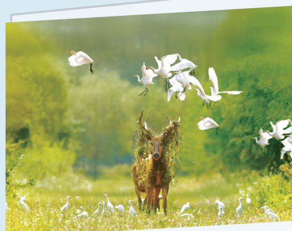
中华麋鹿园