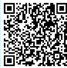
扫描二维码 观看数字人播报

与人才同心、与产业同频、与科技同向。下一步,江苏银行盐城分行将进一步聚焦产业未来所向、地方发展所需、经营主体所盼,让科产融合的火花汇聚成盐城新型工业化发展的磅礴伟力,以金融高质量发展助力中国式现代化盐城新实践迈出新的坚实步伐。