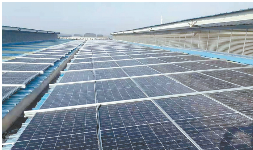
落地江苏省首笔整县屋顶分布式光伏项目