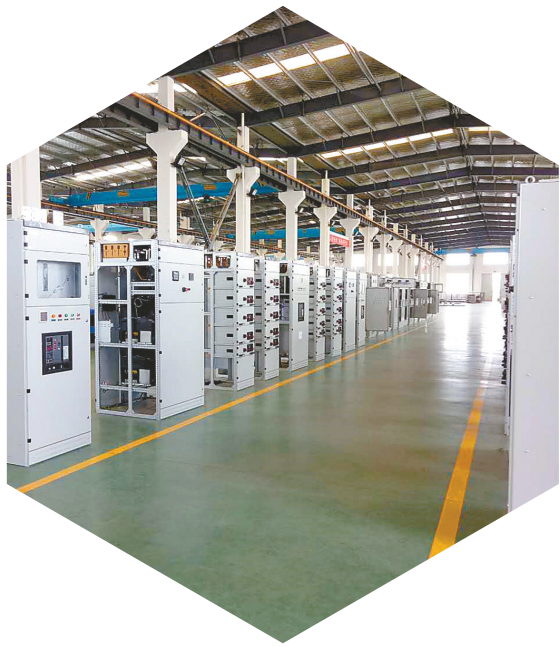
合作企业生产车间

在激情澎湃的时代浪潮中,推动科产深度融合,金融具有双重身份,既处于产业端,是技术的需求者和使用者,又处于资金链上,服务着产学研的各个环节。2024年,盐城高新技术产业产值占规模以上工业总产值达51.4%,"5+2"战略性新兴产业规模全部超千亿元,其中,金融贡献巨大。江苏银行盐城分行深入贯彻国家和省市战略部署,积极落实各项政策要求,坚守"服务科技创新就是服务未来"的理念,不断加大科创人才及科技企业金融供给,构建科技金融特色服务生态,充分调动和激发科技创新和产业发展的活跃因子。