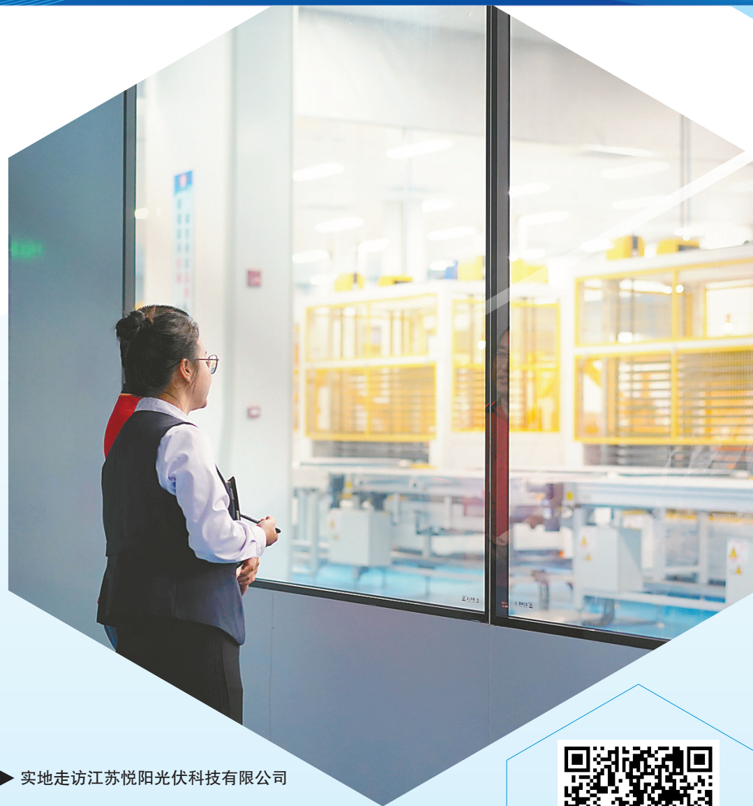
► 实地走访江苏悦阳光伏科技有限公司