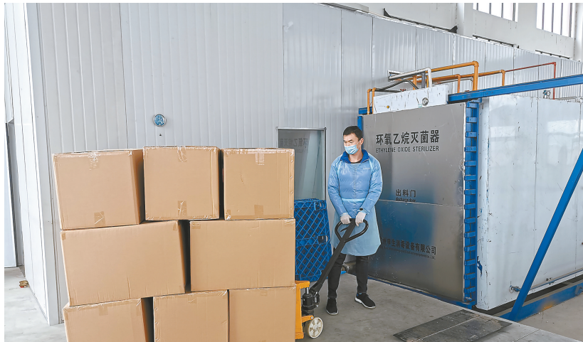
合作企业江苏奥博金医药科技有限公司完善灭菌流程