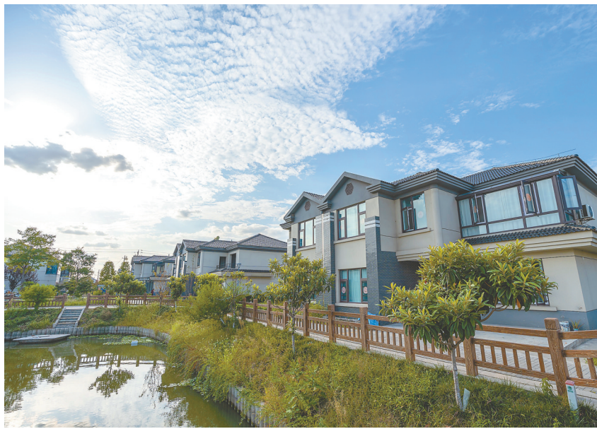
村民集中居住点。

同时,溱东镇创新宣传方式,将阵地建设与理论政策宣传宣讲有机结合。“小喇叭”开讲发挥大作用,每天定时播放党的理论、方针政策、农业技术