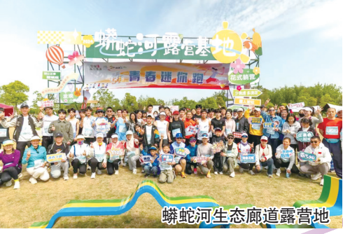
蟒蛇河生态廊道露营地