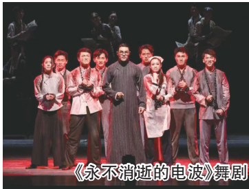
《永不消逝的电波》舞剧

盐城市博物馆新开《神都风韵——洛阳唐三彩专题展》《穹顶下的银辉——奥地利古堡银器艺术展》两大精品展；现象级舞剧《永不消逝的电波》剧场爆满；沉浸式实景演艺《天仙缘》升级回归；《只有爱·戏剧幻城》天天加演。珠溪古镇依托《镜花缘》故事打造的互动演出兼具国潮风与奇幻性，深受年轻人青睐。