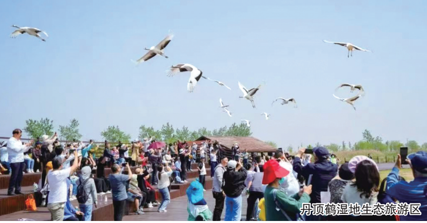
丹顶鹤湿地生态旅游区