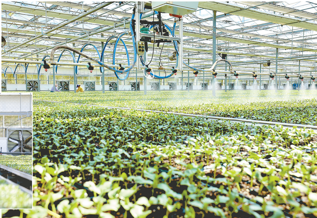
4月18日，丰收大地种苗繁育推广中心内，工作人员正在培育种苗。该中心位于大丰区，总投资约6000万元，预计每年可生产各类种苗1亿株，具备铁皮石斛、红景天、黑枸杞等药用植物的规模化生产能力。该中心还建立研繁推一体化产业联盟，通过优化种苗品质，提升当地农业生产竞争力，带动周边农民增收致富。