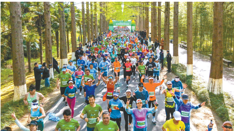
4月13日8时30分,2025黄海森林半程马拉松在东台黄海森林公园鸣枪开跑。来自全国各地3000多名跑者齐聚于此,畅享森林赛道奔跑的乐趣,领略森林马拉松的独特魅力。

马拉松不是一次性的比赛,而是一项持之以恒的运动,只有通过科学训练和充分准备,才能确保安全完赛。