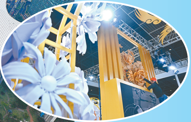
4月10日,展商在消博会主展馆布展。