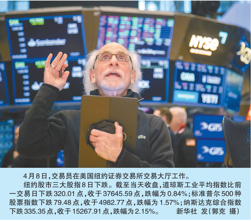
4月8日,交易员在美国纽约证券交易所交易大厅工作。 纽约股市三大股指8日下跌。截至当天收盘,道琼斯工业平均指数比前一交易日下跌320.01点,收于37645.59点,跌幅为0.84%;标准普尔500种股票指数下跌79.48点,收于4982.77点,跌幅为1.57%;纳斯达克综合指数下跌335.35点,收于15267.91点,跌幅为2.15%。