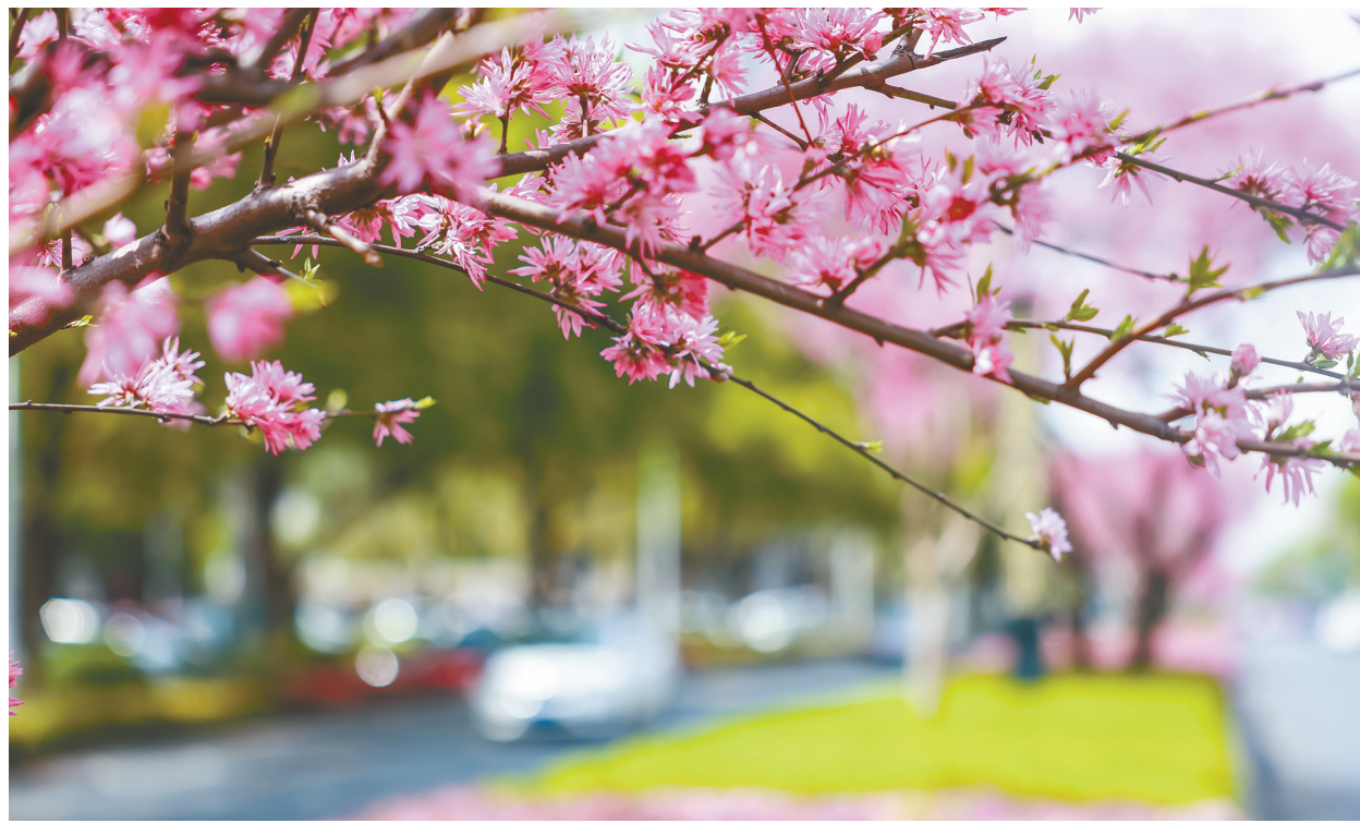
繁花树下画春笺