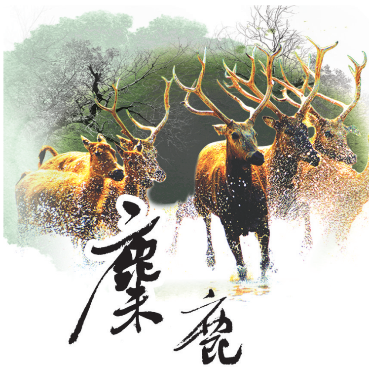
题字:赵守阳