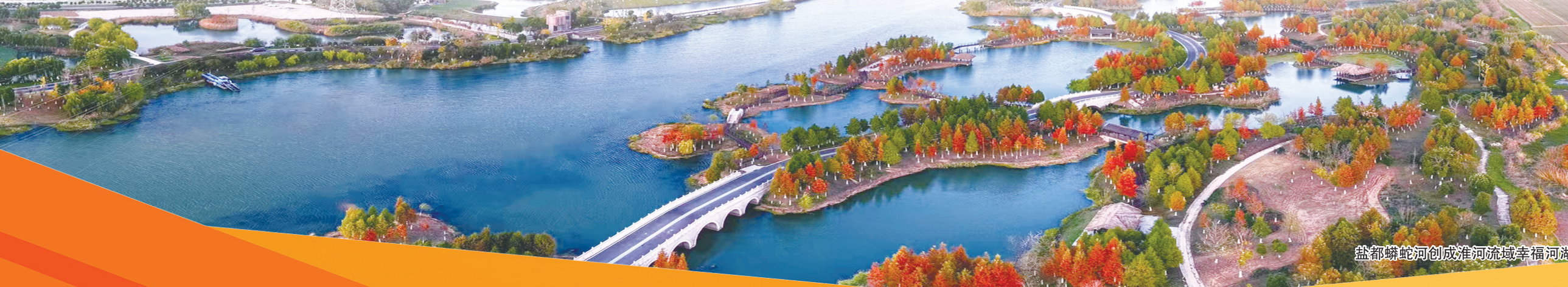
盐都蟒蛇河创成淮河流域幸福河湖

持续实施水利党建引领工程,抓实党纪学习教育“后半篇文章”,用好淮河入海水道二期、苏北灌溉总渠等红色水利工程平台,强化水利行业精神教育,深化“串场河学习社”“支部建在工地上”等党建品牌,推动党建与业务深度融合。