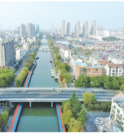
东台市区二女桥全貌