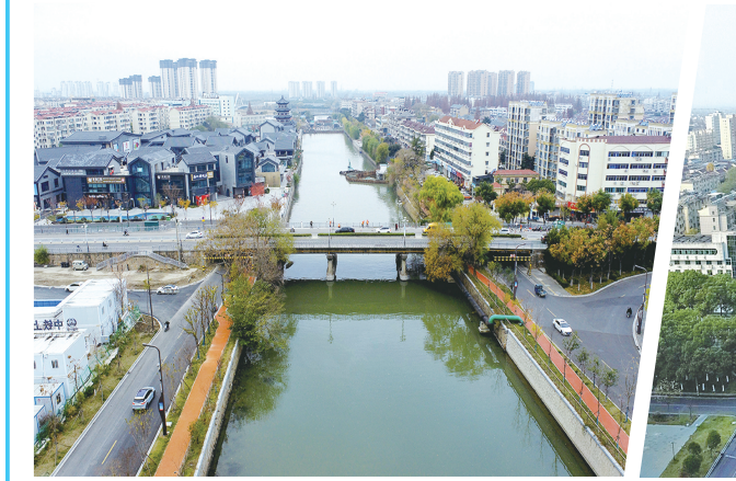
东台市区东亭桥全貌