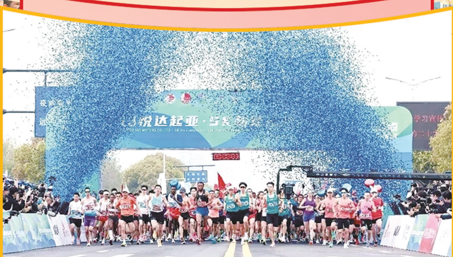
“盐马”品牌越来越靓