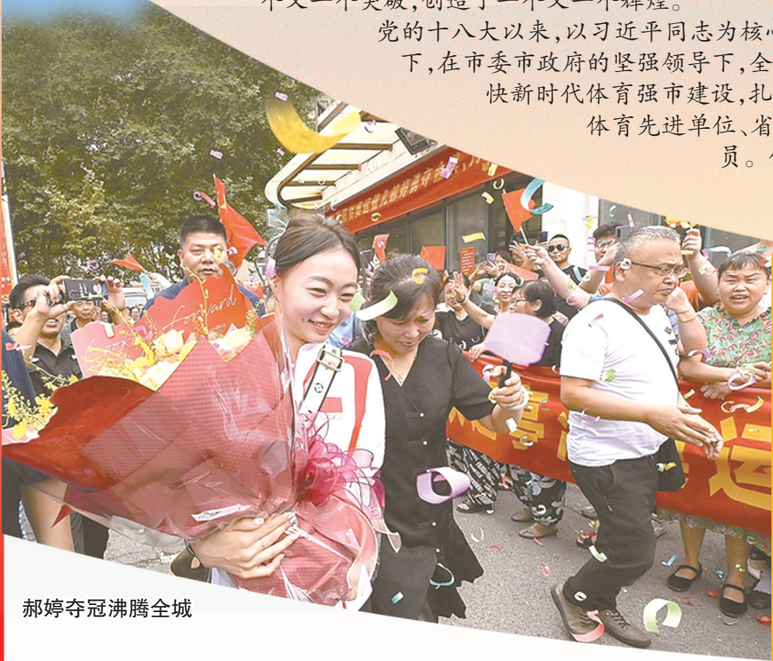
郝婷夺冠沸腾全城

党的十八大以来,以习近平同志为核心的党中央站在国家强盛、民族复兴的战略全局,高度重视体育事业发展。在习近平新时代中国特色社会主义思想的指引下,在市委市政府的坚强领导下,全市体育系统认真贯彻落实习近平总书记关于体育的重要论述,以创建国家第二批全民运动健身模范市为抓手,不断加快新时代体育强市建设,扎实推进竞技体育、群众体育、体育产业协调发展,深入推动全民健身和全民健康深度融合。先后被评为全国群众体育先进单位、省公共体育服务体系示范区、省竞技后备人才输送先进单位,涌现出奥运冠军骆晓娟、郝婷等一批优秀运动员。体育正日益成为引领人民群众高品质生活的新风尚,提升城市凝聚力、影响力的重要载体。