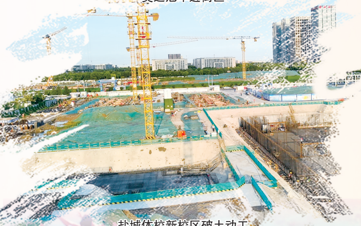
盐城体校新校区破土动工