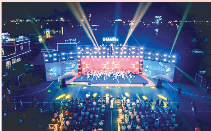
社超联赛万众参与

· 骆晓娟获得2012年伦敦奥运会女子重剑团体冠军,郝婷获得2024年巴黎奥运会艺术体操集体全能冠军,於秀敏获得2007年世界飞碟锦标赛冠军,韦奕两次获得国际象棋奥林匹克团体世界冠军,蒯曼夺得乒乓球世界杯赛季军、全国锦标赛混双冠军。至此,我市已培养了奥运冠军2人、世锦赛冠军2人、世青赛冠军2人、世界军人运动会冠军1人、亚运会冠军2人。