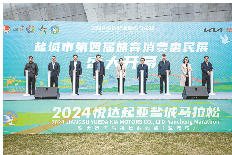
体育消费惠民展盛大开幕

· 2024年盐城马拉松开跑前夕,4月11日-13日,市体育局、市发展和改革委员会、市商务局、市市场监督管理局、市文化广电和旅游局和盐南高新区组织了市第四届体育消费惠民展,现场参展商家近100家,总面积达10000㎡,成交额超600万元,进一步激发盐城体育市场消费活力,创新体育消费场景,打造体育消费新IP,实现体育为经济赋能。