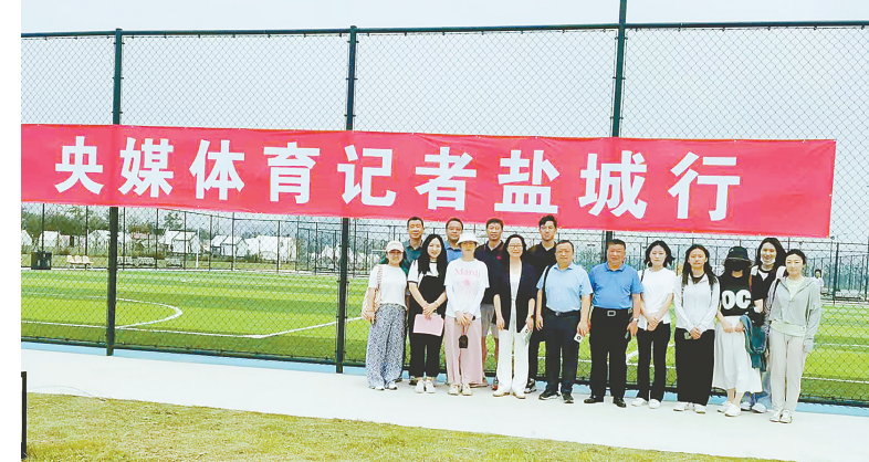
央媒体记者走进盐城

· 开展体育赛事“进景区、进街区、进商圈”活动,打响“跟着赛事游盐城”体育赛事消费品牌,全年有近1000场赛事在各地旅游景区举办,其中2024年全国体育赛事“三进”活动暨江苏省《国家体育锻炼标准》达标赛在大洋湾景区成功举办。比赛期间,来自人民日报、新华社、中国体育报等16家中央主流媒体组团开展“央媒体记者盐城行”活动,报道我市体育赛事“三进”做法,沉浸式感受盐城的生态文化和水乡文化。