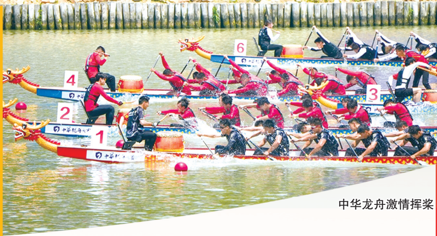
中华龙舟激情挥桨