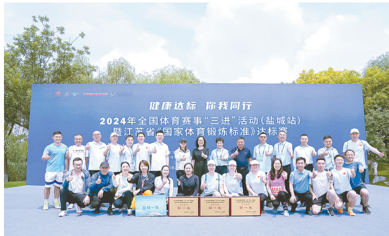
赛事“三进”拉动消费

· 市政府成立创建国家全民运动健身模范市工作领导小组,召开高规格的全市创模工作推进部署会,坚持目标导向和问题导向,统筹规划、查漏补缺、打造品牌,我市成功入围国家体育总局第二批创建名单。