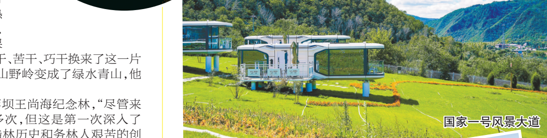
国家一号风景大道