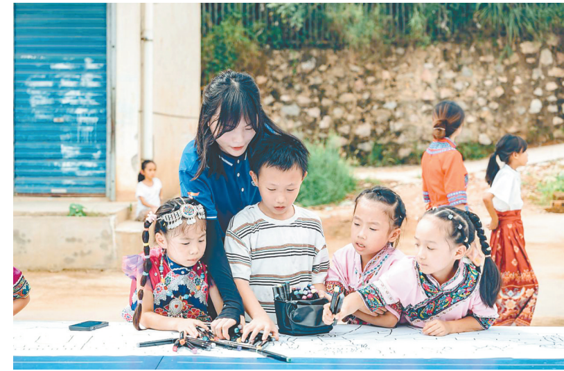
实践团成员精心指导孩子们画画

本报讯(沈妍)近日,盐城师范学院教育科学学院“点亮微光 盐青先行”实践团走进广西壮族自治区灵川县海洋乡开展“石榴花开向党,民族团结一家亲”民族团结实践活动。在这片充满希望的土地上,一群斗志昂扬、拼搏向上的热血青年与淳朴的孩子们结下了不解之缘。 在教室里,实践团为当地孩子开展有关民族团结的教育教学活动。团队成员向孩子们讲述新四军的英雄历史,教授孩子们学唱《同心共筑中国梦》《我和我的祖国》等爱国歌曲,还向他们介绍国旗、国徽、国花的由来。让孩子们意识到民族精神是一个民族生命力、创造力和凝聚力的集中体现,是一个民族赖以生存、共同生活、共同发展的核心和灵魂。 活动中,实践团成员用浅显易懂的语言,向孩子们讲述了中华民族的传统及民族团结的重要意义,并与孩子们进行互动,引导孩子们“说”出对民族团结的认识。随后,志愿者们给孩子们分发精心准备的民族团结涂鸦画布和颜料,在团队成员的