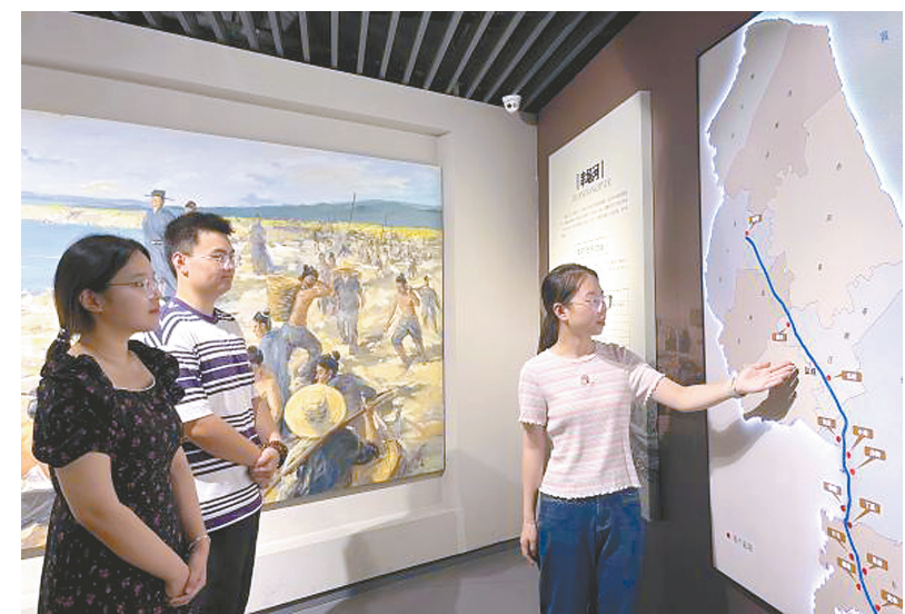
实践团探究串场河历史

本报讯(张可馨 朱静怡)8月19日至24日,盐城师范学院城市与规划学院“绿韵盐城 环保同行”社会实践团来到响水县、阜宁县、亭湖区等地开展暑期“三下乡”活动,旨在倡导绿色文明意识、生态环保意识和可持续发展意识,为盐城市生态文明建设贡献青春力量。 探寻盐城文化根脉,共护母亲河。实践团在亭湖区开展“河”我一起共护串场河”主题实践活动。大家集体前往中国海盐博物馆参观学习,深入了解了海盐文化。随后,他们在串场河沿岸开展实地调研,通过问卷调查和访谈,收集居民对串场河现状的认知与期待。在调研过程中,团队还组织开展了净滩行动,清理河岸垃圾,以实际行动保护母亲河。 倡议低碳生活,传播绿色理念。实践团走进响水县大有镇大有社区和新时代文明实践所,开展“和我一起做‘A4210’理念”宣讲,围绕垃圾分类、变废为宝、资源节约、光盘行动、绿植养护等内容,结合“A4210”环保理念,呼吁社区群众形成节约环保的好习惯。 手绘绿色盐城,传递生态之美。实践团赴阜宁县暖心驿站开展“和我一起做绿色盐城”手绘活动。团队宣讲员通过现场讲解、投放展板等方式带领小学生一起领略盐城的生态之美、人文之美、建筑之美。团队成员从自然风景、典型建筑、人文风情、城乡新貌等方面着手,带领小学生绘出自己心中的绿色盐城,感受盐城“国际湿地、沿海绿城”的生态魅力。 绿韵盐城宣讲,环保同行共创。实践团联合亭湖区洋西社区、盐南高新区鹿鸣社区开展绿色盐城环保主题宣讲活动。团队成员向社区居民介绍了盐城绿色发展的现状和作为“国际湿地城市”所承担的责任。同时,围绕日常衣食住行,实践团向居民普及节水节电、低碳生活小技巧,引导大家从自身做起、从家庭做起,树立低碳生活理念,培养绿色生活习惯,守护绿色盐城。 通过一系列实践活动,盐城师范学院“绿韵盐城 环保同行”社会实践团不仅为盐城的绿色发展贡献了青春力量,也为自身成长积累了宝贵经验。未来,将继续以实际行动为盐城的绿色发展贡献青春智慧。 手绘绿色盐城,传递生态之美。