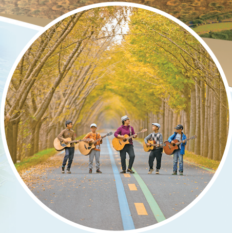
琴声悠扬