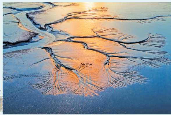
金滩鹿影

——建立协同机制。盐城市创设“政府+联盟+协会+志愿者”协同保护机制,先后组建条子泥湿地研究院,北京林业大学东亚—澳大利亚候鸟迁徙研究中心东台基地等机构,常态化开展鸟类、底栖、大气、水体等专题研究,持续发力湿地修复和生态保护。