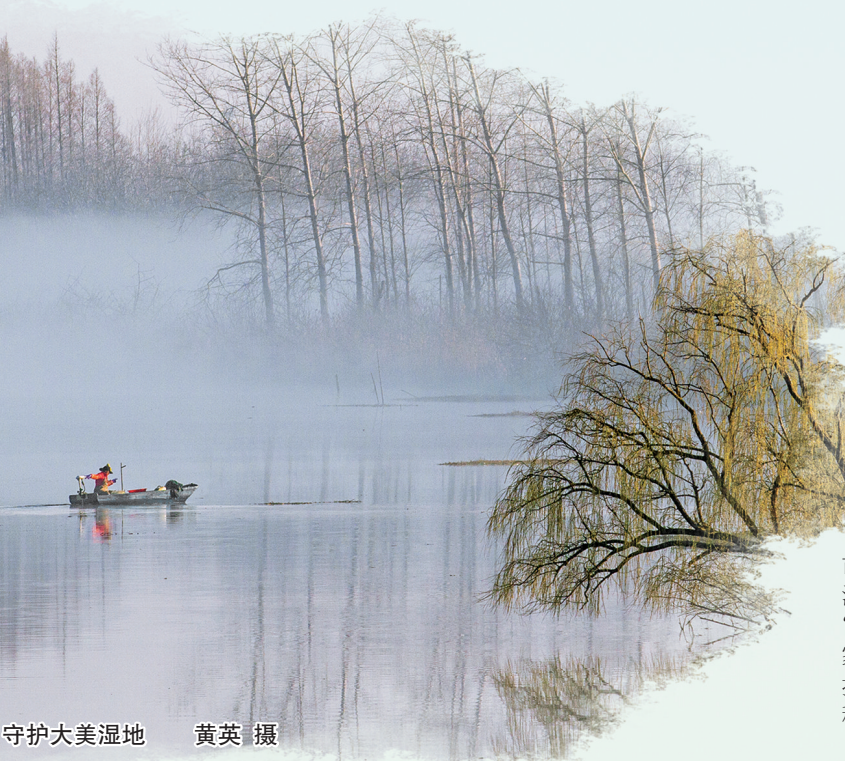
守护大美湿地