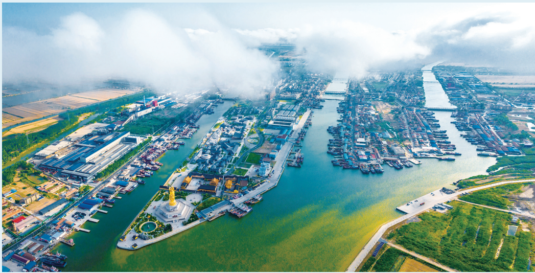
湿地渔港

盐城用中国方案启迪了世界,也集聚着全球智慧,共谋“诗情画意”。自觉担当起生态文明理念的积极传播者、践行者,盐城用坚守和实干回答人与自然和谐共生的时代命题,为全球生态治理和滨海地区可持续发展贡献盐城智慧。