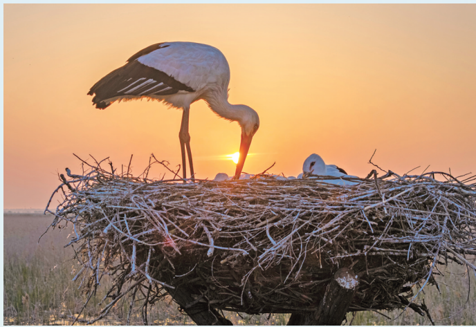
精心哺育

成功申遗五年来,盐城深入践行习近平生态文明思想,认真落实习近平总书记关于湿地保护的重要指示要求,以强大的定力和长远的眼光,全力推动湿地保护与世界自然遗产可持续发展,在实践探索中交出了耀眼答卷。