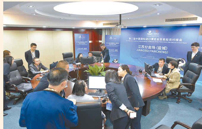
组织百余家企业在盐城视频参加中国国际进口博览会