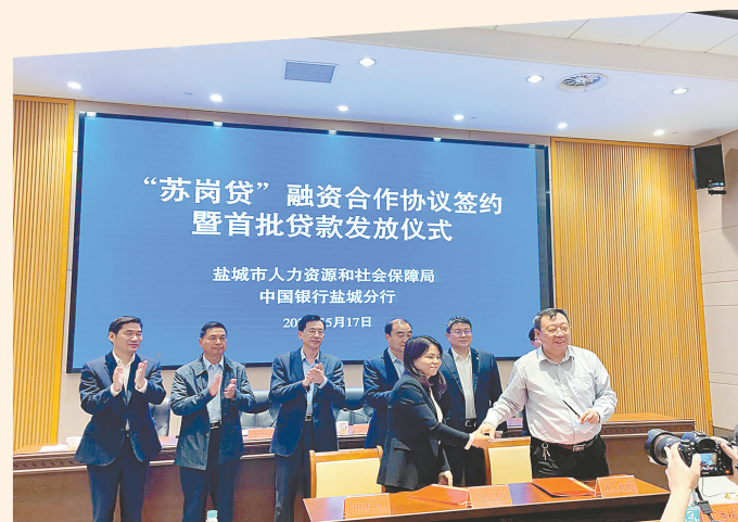
与市人社局进行“苏岗贷”业务合作签约