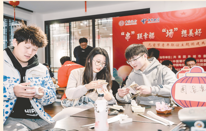
开展“一见倾心”青年联谊活动