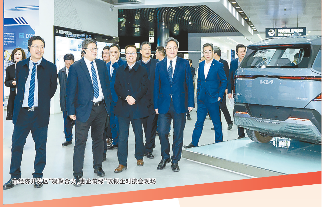
市经济开发区“凝聚合力,惠企筑绿”政银企对接会现场