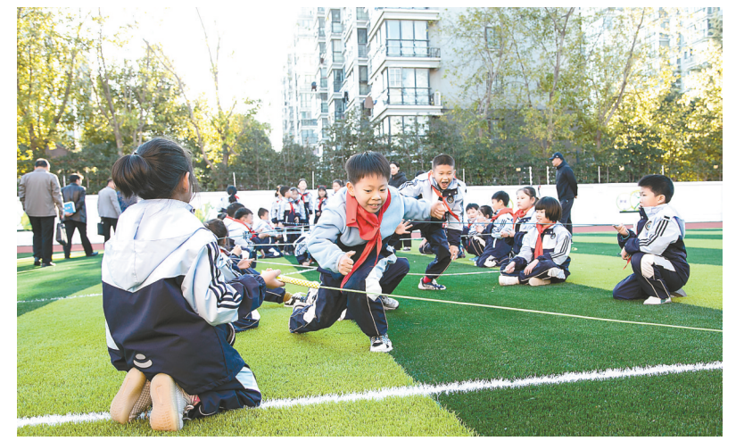
神州路小学积极落实“双减”政策，开展丰富多彩的大课间文体活动，保证学生每天有1小时以上的锻炼时间，手势舞、韵律操、轮滑、篮球、足球等趣味活动的融入，促进了学生全面发展和健康成长。

盐城市吴拾路小学校长鲍丽斌告诉记者，吴拾路小学致力于构建培养儿童审美的和美课程体系，涵盖艺术审美、运动审美、学科审美、科学审美等方面，让学生在感受美、热爱美、创造美的过程中学会生活、学会学习、学会创造。