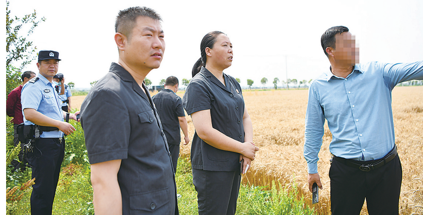
建湖法院干警走进田间地头处理纠纷,保障了1600余亩小麦的“颗粒归仓”。

此外,该院不断延伸司法审判职能,在“世界环境日”“全国土地日”“植树节”等重要节点,积极开展系列环保主题普法宣传活动,向来往游客发放宣传手册,耐心讲述环境保护的重要性和破坏生态环境的严重后果,营造全民参与环保的良好氛围。