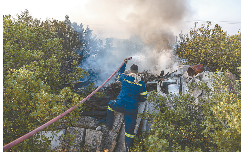
7月20日,在希腊雅典西郊的圣索蒂拉,一名消防员进行灭火作业。希腊是地中海气候,夏季高温干旱,遇上持续大风天气,极易发生野火。

经过长期建设,我国基层中医药服务能力显著提升。来自国家中医药局的数据显示,截至2021年底,我国社区卫生服务中心、社区卫生服务站、乡镇卫生院、村卫生室的中医诊疗量占同类机构总诊疗量比例达到22.7%,超过八成社区卫生服务中心和乡镇卫生院能够提供6类以上中医药技术方法。